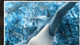
Éghajlat-politikai irányítás és tájékoztatás