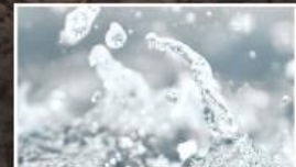
Alkalmazkodás az éghajlatváltozáshoz