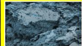
Környezet és erőforráshatékonyág