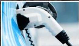
Az éghajlatváltozás mérséklése