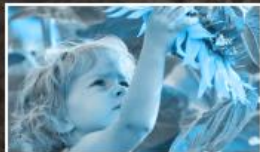
Környezetvédelmi irányítás és tájékoztatás