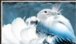
Természet és biodiverzitás