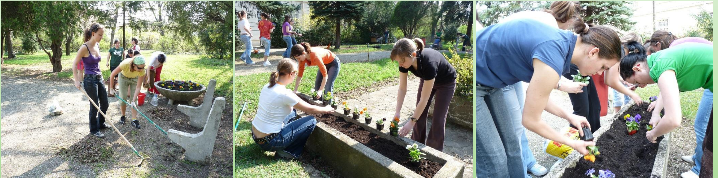
Tavaszi kertrendezés-virágültetés a kar kertjében