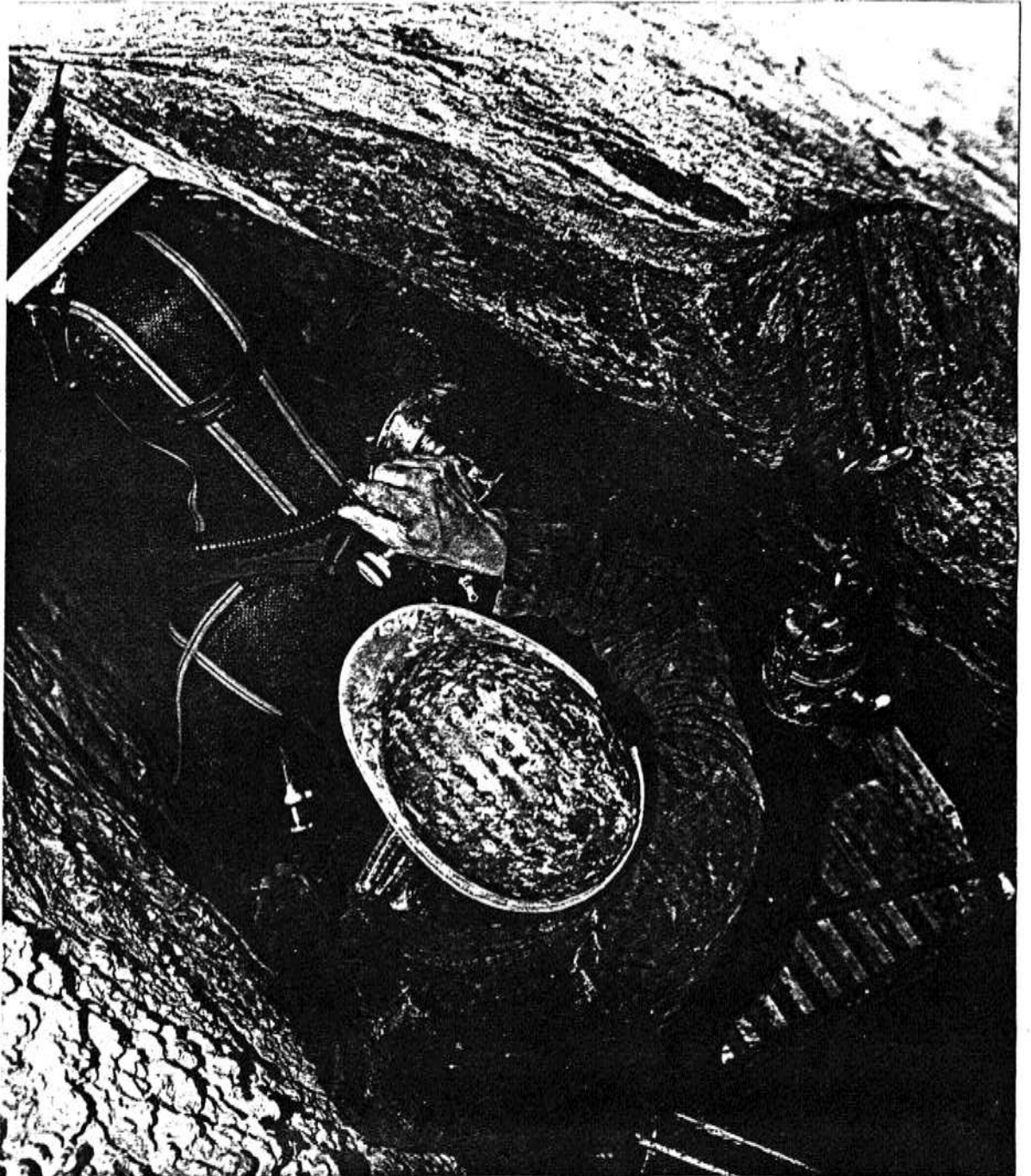
Készülődés a bázison.