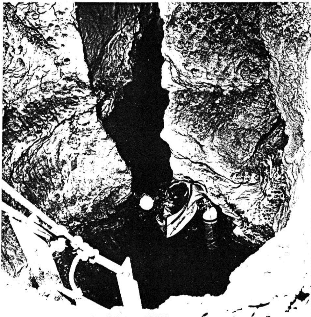
Merülés előtt a felderítő buvárok egyike.