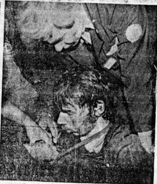
* Az alázuhogó hideg karsztvízben teljesen átfagyott a sérült fiú, és a mentésben résztvevők is.