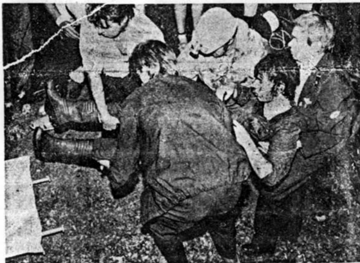
Újra a felszínen

Kerék Csaba sporttárs balesetéről tudósító cikkek a