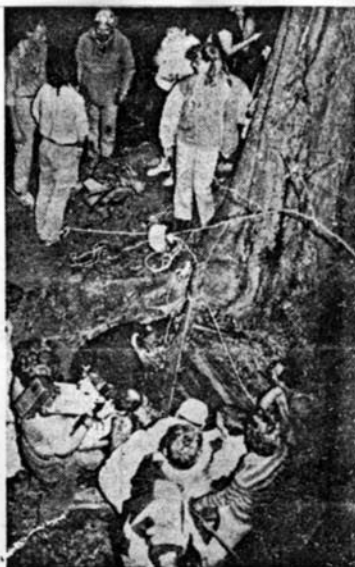
A barlangi mentők élő láncot alkotva kézzől kézre adták a sérültet