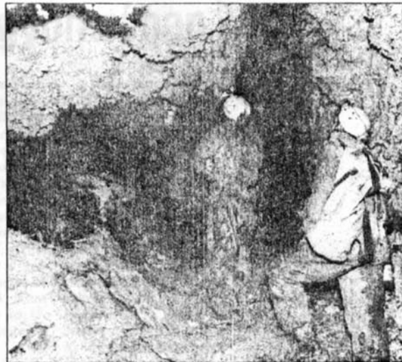
sopda" a Merciknek? A kép jobb szélén a polgármester: ...a balhék már 84-ben megkezdődtek...