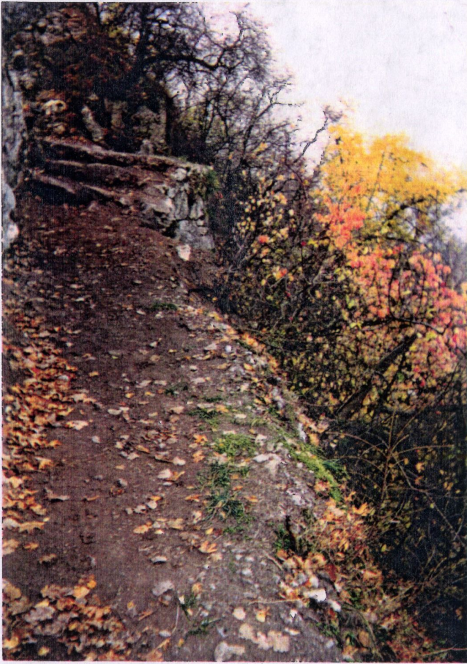
A barlanghoz vezető megtisztított turis- taut. /24/