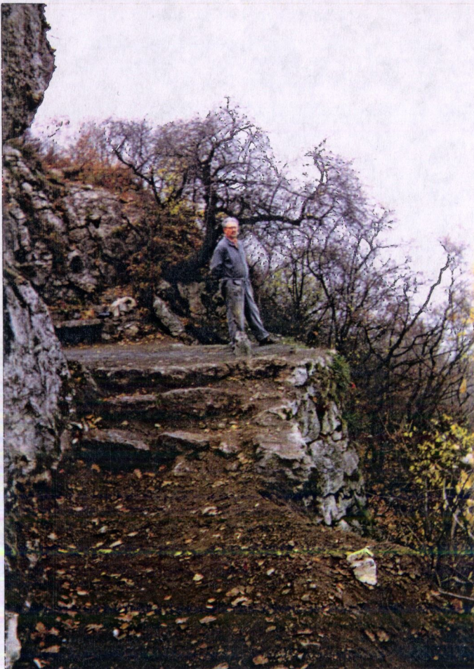
A turistaút csatlako- zása a teraszhoz. /22/