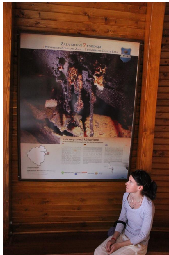
Millenniumi Emlékműben / Zalavár/ bemutatásra került „Zala hét Csodája”