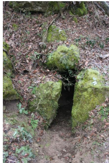
A feltárandó hasadék és környezete (bal oldali, valamint középső kép, a jobb oldali felvételen a barlang jelenlegi bejárata)