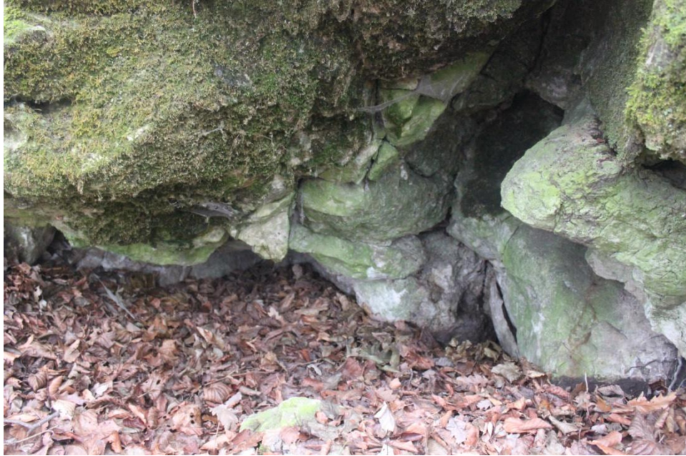
A környékre jellemző oldásos kőzetek