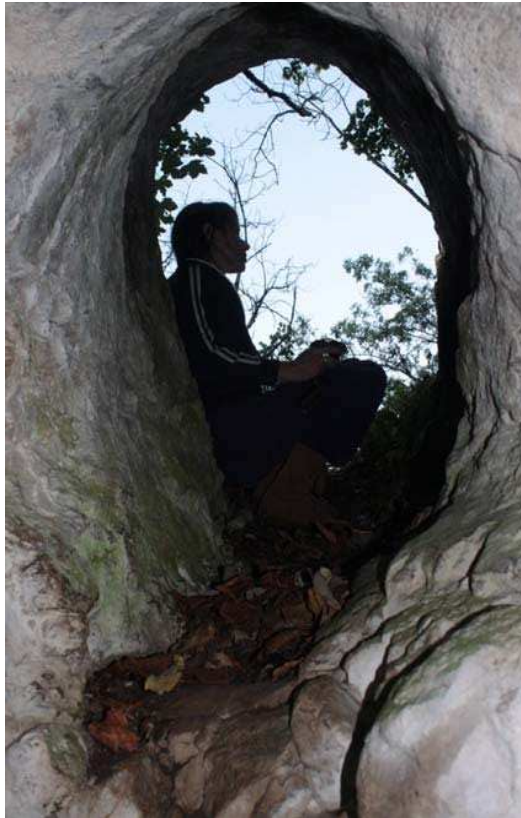
A barlang bejárata