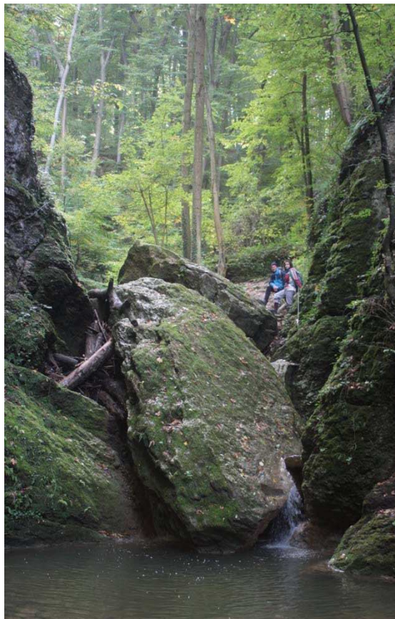
Bakony / Ördög – árok / Gizella átjáró