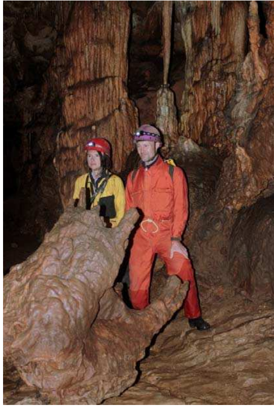
Aggtelek / Baradla – barlang / Retek - ág