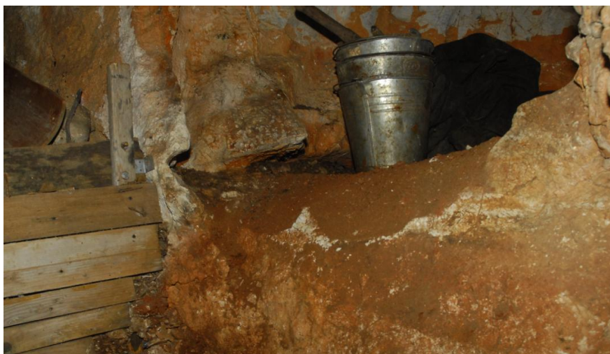
Az oldalág elhelyezkedése, és a kitakarítás utáni állapot.