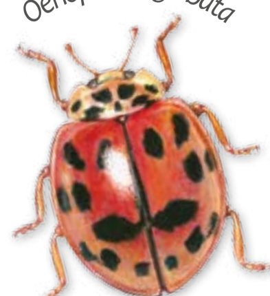
rózsás katica Oenopia conglobata

A Kelet-Ázsiából érkezett harleinkatica nagytestű, falánk, gyorsan szaporodó bogár. Emiatt versenytársa a hazai fajoknak, és kiszorítja őket az élőhelyükről. Amikor telelni készül, sokszor nagy tömegben lepi el a lakásokat.