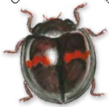
szalagos szerecsenkata Chilocorus bipustulatus

Ismerd meg Magyarország leggyakoribb katicabogarait!