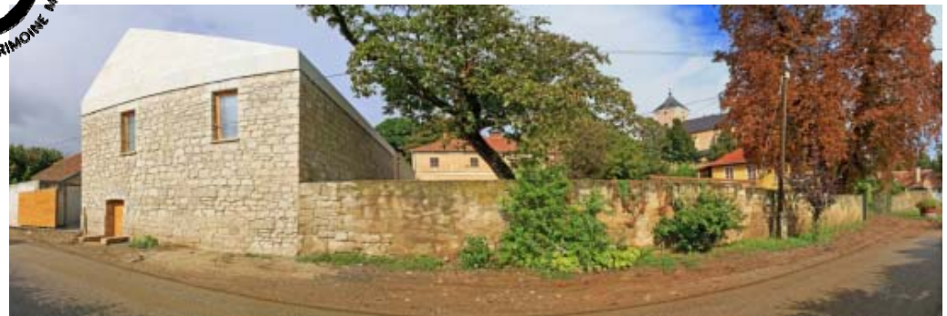
Az év épülete 2011 – ipari építészet (ArchDaily.com)