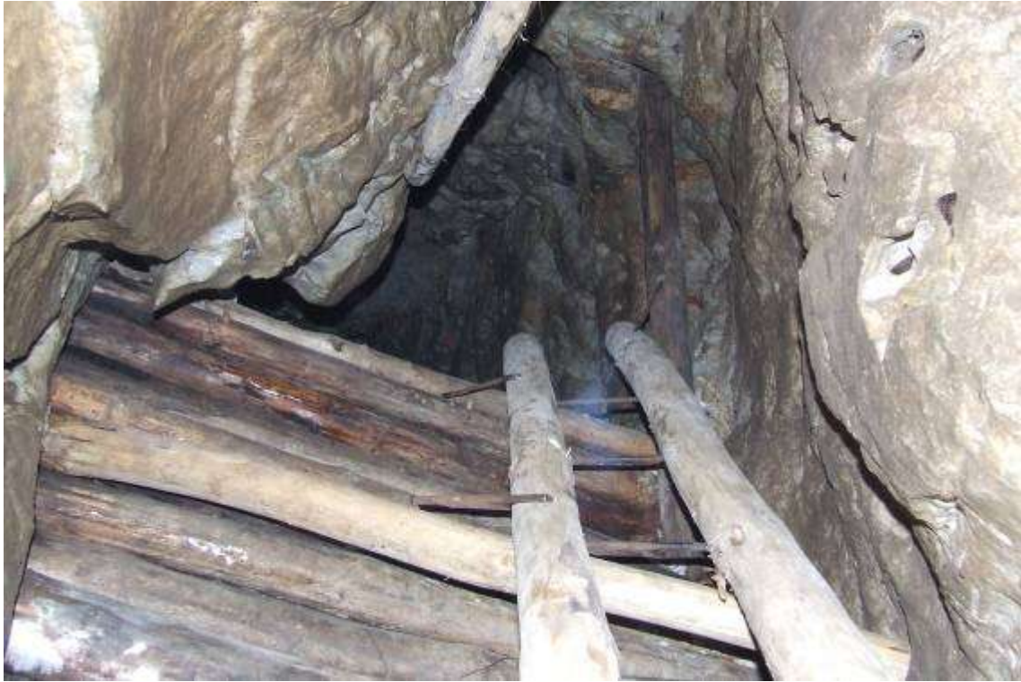
A felszín-közeli törmelékfogó ácsolat és a létracsúszda első tagja