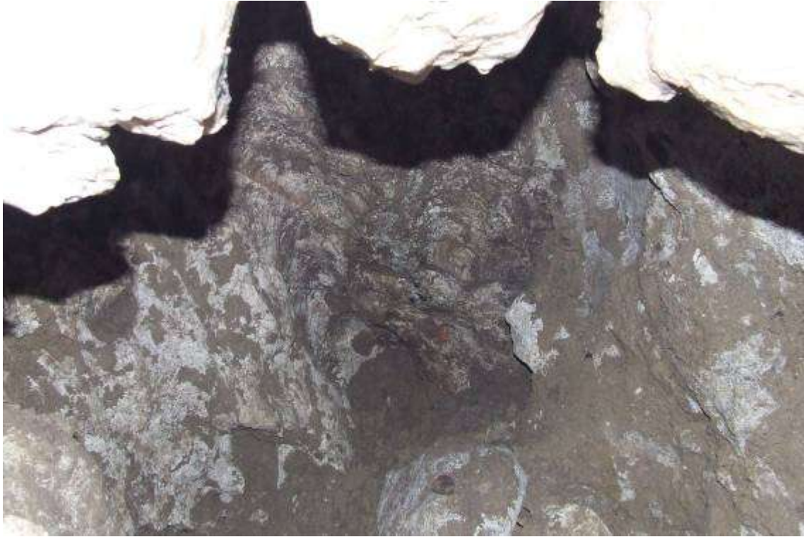
A barlang jelenlegi végpontja