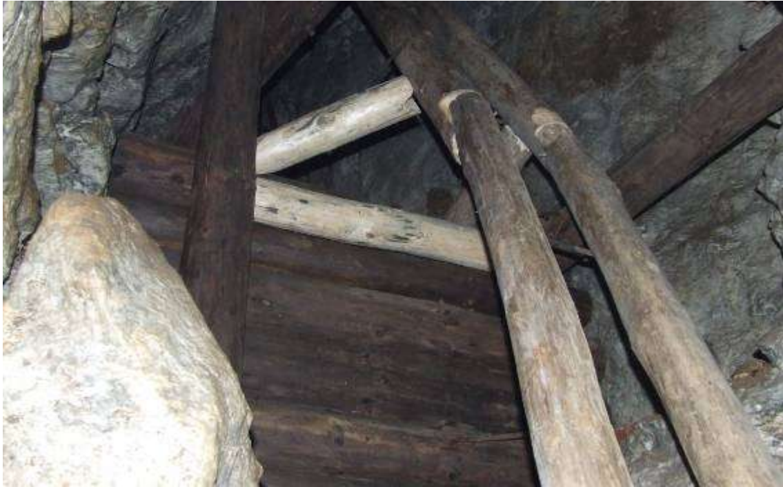
A második-harmadik tag csatlakozása az alsó ácsolattal