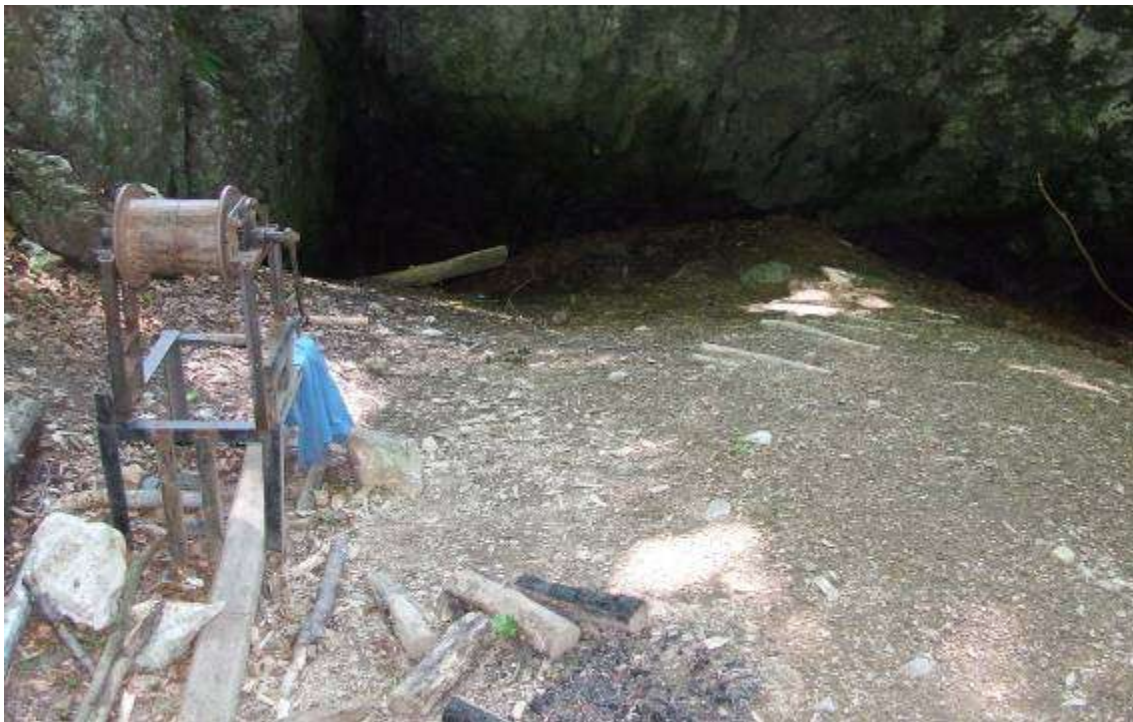
A barlang bejárata a felújított csörlővel