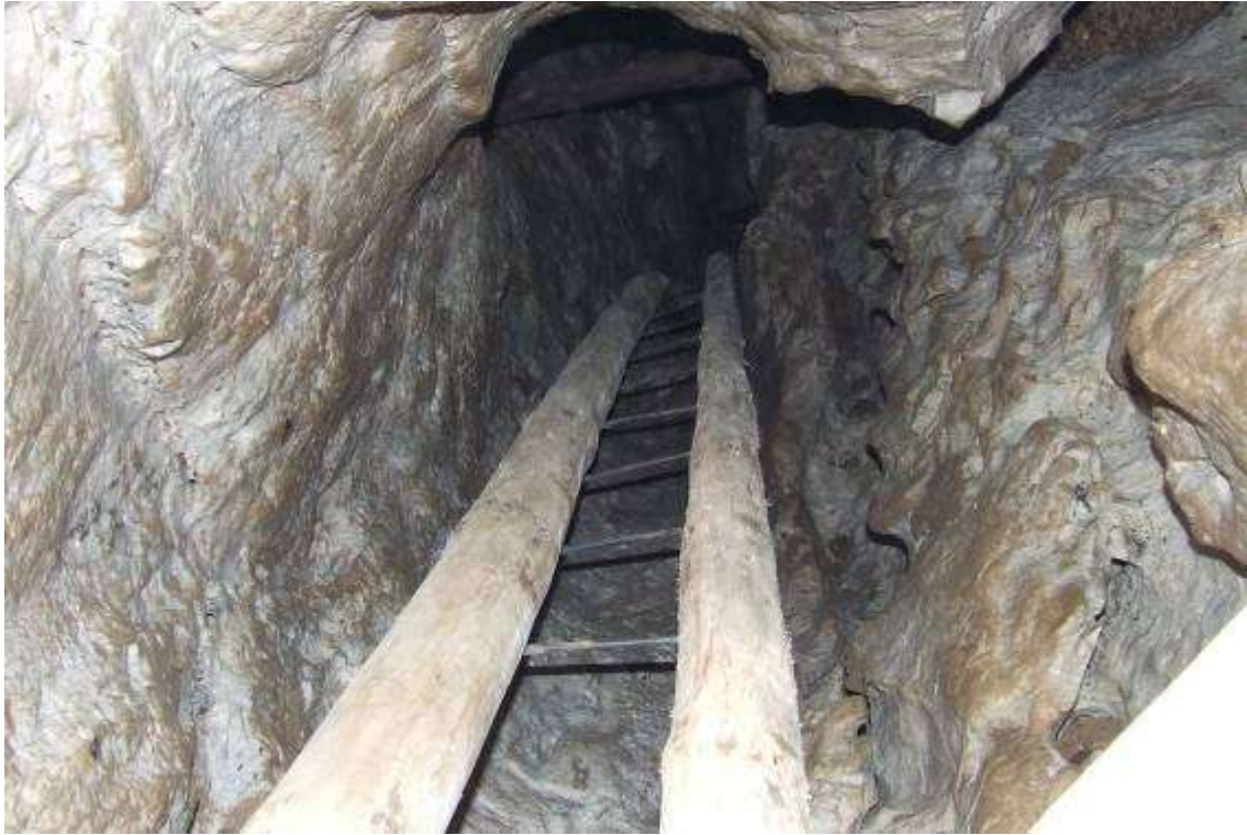
A létracsúszda negyedik tagja az akna aljából