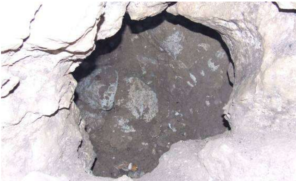
A végponti terem bejárata