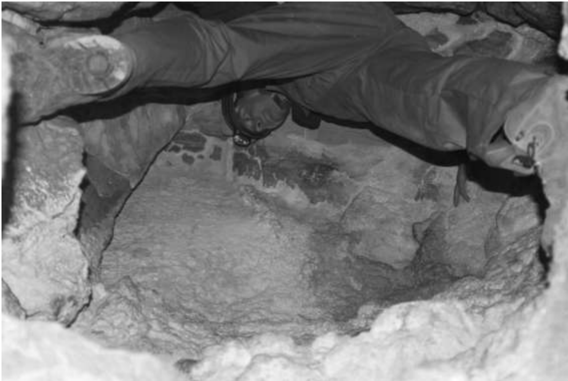
3. kép A végponti akna felső része