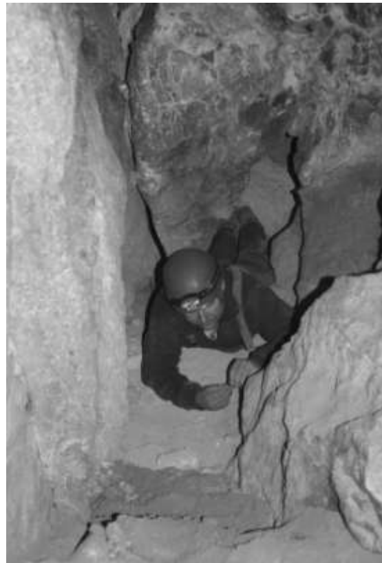
5. kép Átbújás a beszorult kötömb alatt