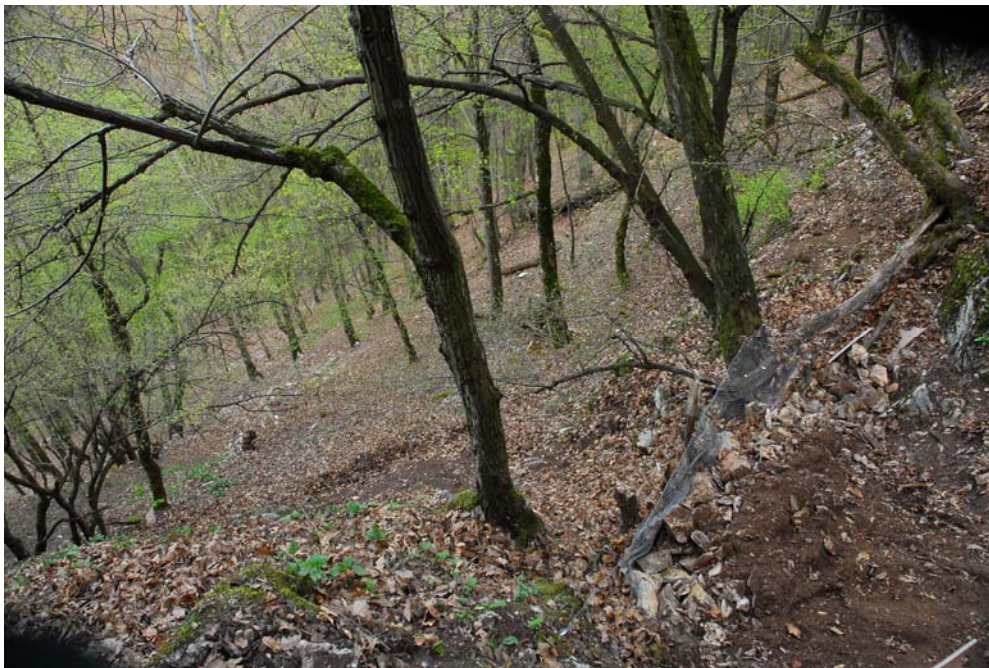
A depó állapotán nem látszott meg a tél nyoma

A csúszda beöntő garatjánál történt kis törés, de ez nem okozott problémát. Emellett a kitöltés eltávolítása is tovább folytatódott.