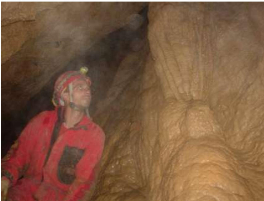
4. ábra: Hasadék a Harang-kürtő mellett

A Harang-kürtő mellett kiterjedt hasadékrendszerbe lyukadtunk, mely képződményekben igen gazdag.