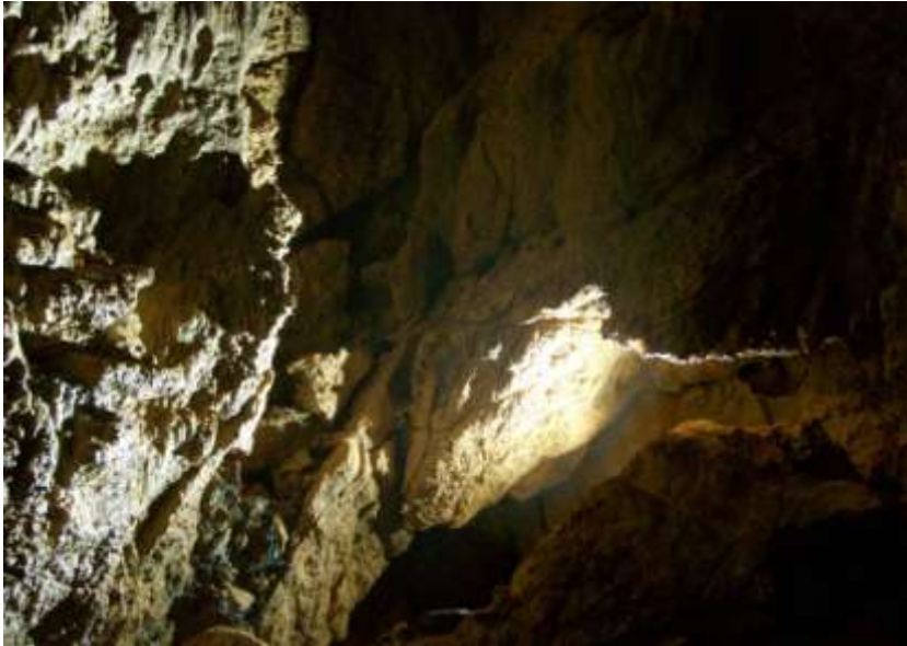
3. ábra: A Harang-kürtő bejárata

A formájáról Harang-kürtőnek elnevezett kürtő alapterülete 6 x 8 méter, magassága pedig meghaladja a 24 métert!