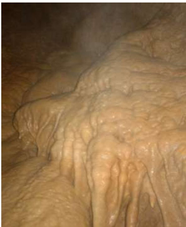
7. ábra: Cseppkőzuhatag a hasadék déli falán.

A most feltárt új járatrész őszhosszúsága már jelenleg is meghaladja a 100 métert.