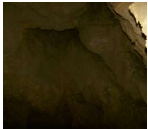
1. és 2. ábra: A Harang-kürtő és a mennyezete

A Spirálszíve-teremtől dél-nyugati irányban hatalmas kürtőbe, valamint a szomszédságában összetett hasadékrendszerre bukkantunk, mely képződményekben rendkívül gazdag.