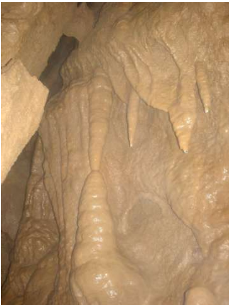
5. ábra: A Spirálszíve-terem mennyezete fölé vezető hasadék bejárata.

A hasadékrendszer egyik ágából bejutottunk a Spirálszíve-terem mennyezetéből nyíló Nagy-kürtőbe is.