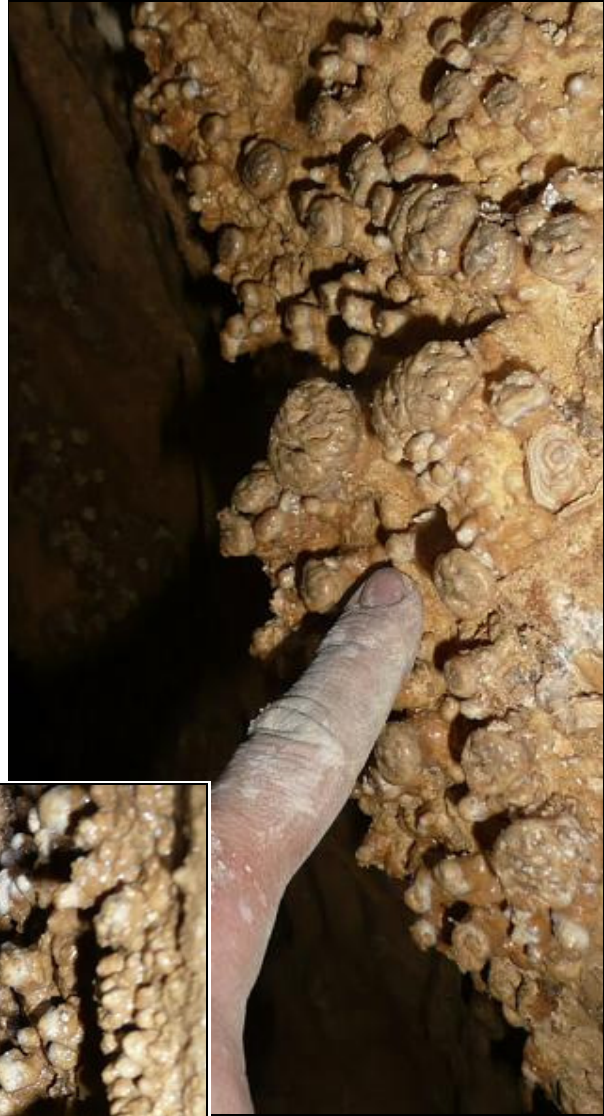
4. fotó: Borsókő