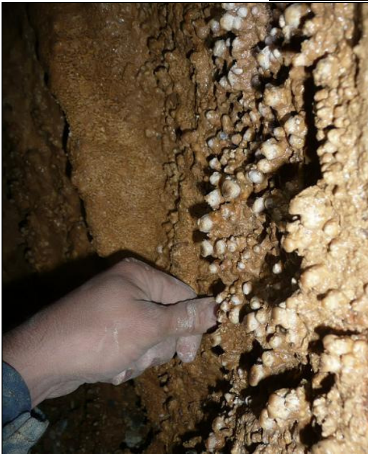
5. fotó: Borsókövek