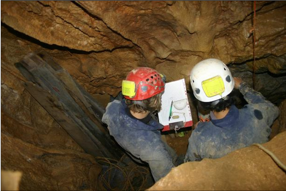
1. fotó: Térképezés közben 1.