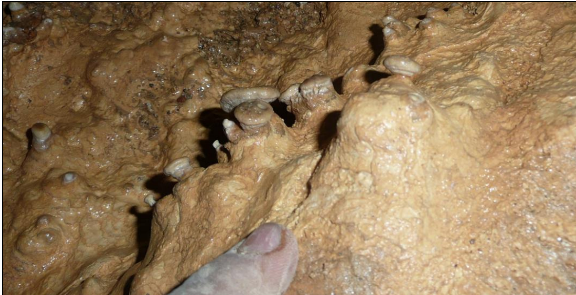
2. fotó: Borsókövek a Gazdag-rét nevű járat déli oldalán