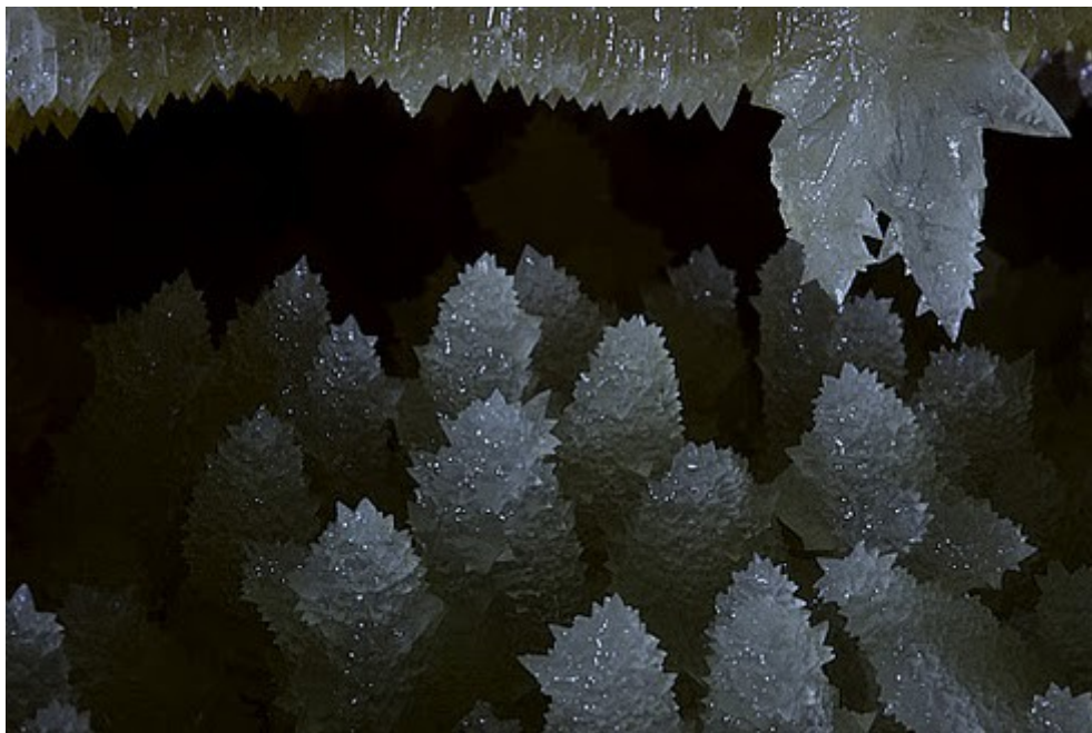
Fotó: Magyar Péter