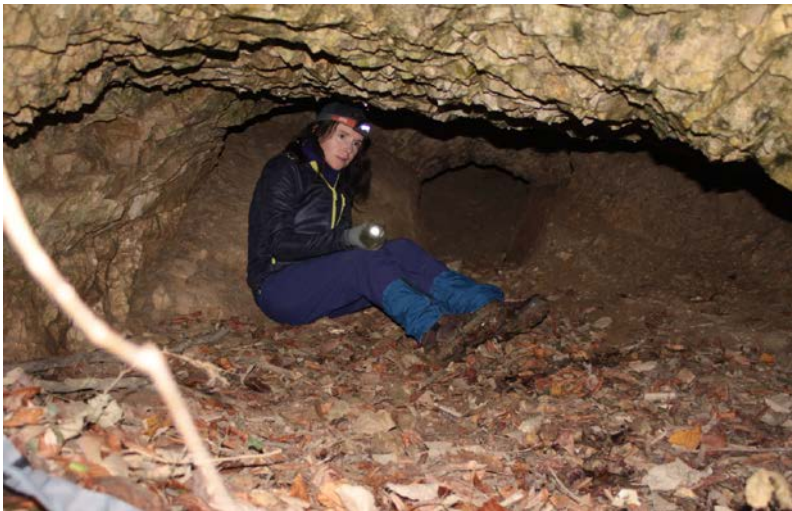
Lovaskatona 3. sz. - barlang