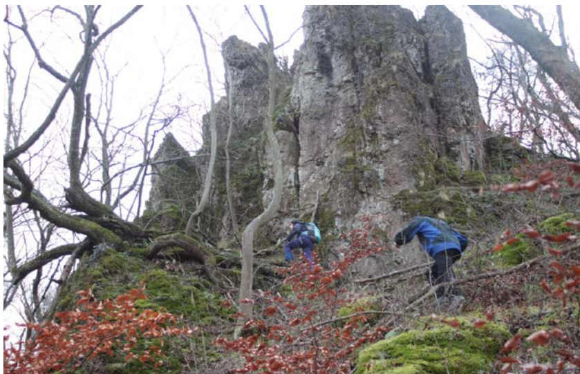
Csókakői - árok