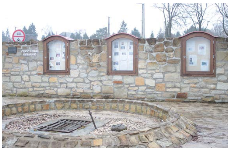
A kút környékére épített kőfal, barlangi tájékoztató, valamint kútkáva kövezete