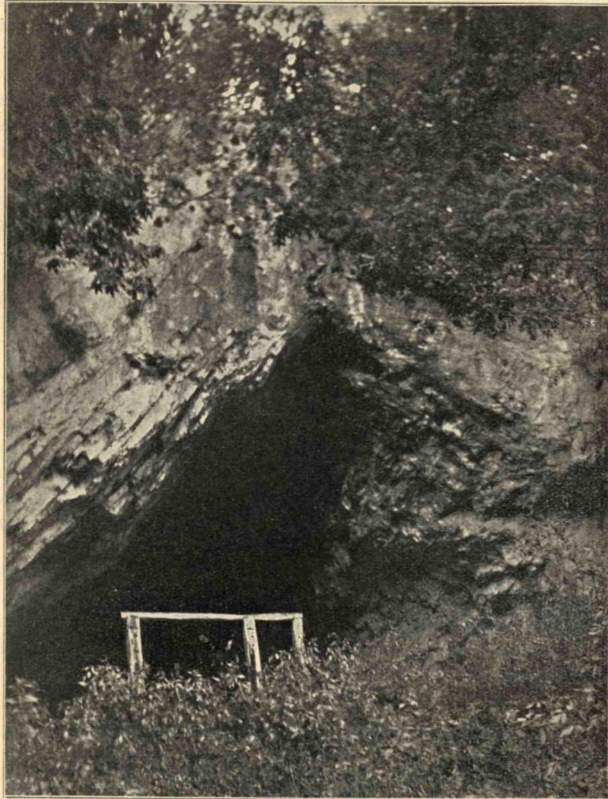
2. ábra. Az Istállóskői barlang bejárata.