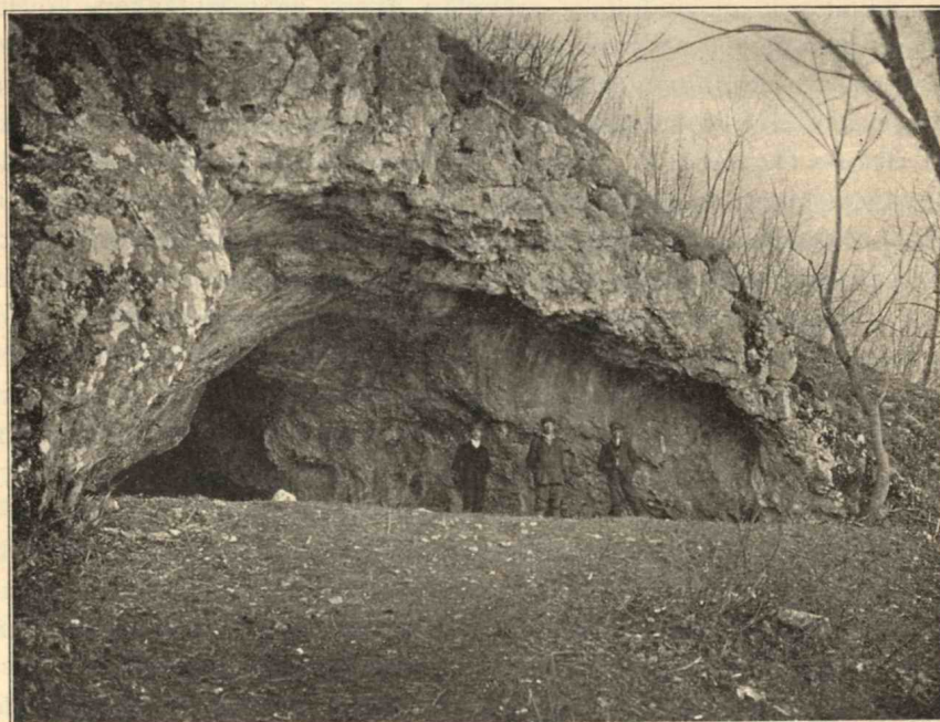
1. ábra. A Kiskevélyi barlang bejárata.

A Budapest közelében lévő csobánkai Kiskevélyi barlangot dr. KOCH ANTAL tanár fedezte fel és ismertette a Földtani Társulat 1868 dec. 23.-i szakülésén. KOCH tanár a kincésásóktól feltárt rétegekből sok ősmadvecsontot gyűjtött s jelentésében kiemeli, hogy rendszeres ásatással még sok ősemlecsont kerülhetne ki. Hogy feltevése alapos volt, azt a legutóbbi ásatások alkalmával e barlangból napfényre hozott emlős fauna bizonyítja, melyhez foghatót még nem igen ismerünk