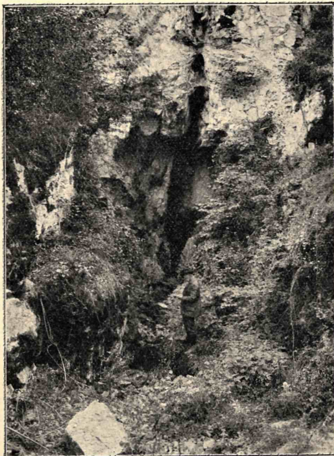
A mátfai barlang bejárata.

kémiai sajátosságaihoz kötött s közvetlenül a hegység belsejében szivárgó talajvizek oldó munkájára vezethető vissza. A barlang kőzetei általában szürkés színű, helyenként mészpáterekkel átjárt, tömör, kissé bitumenes mészkövek. A bejárható folyosószakaszban a cseppkőképződés jelentéktelen, a falakat azonban, itt-ott vékony mészkéreg (travertino) lepi.