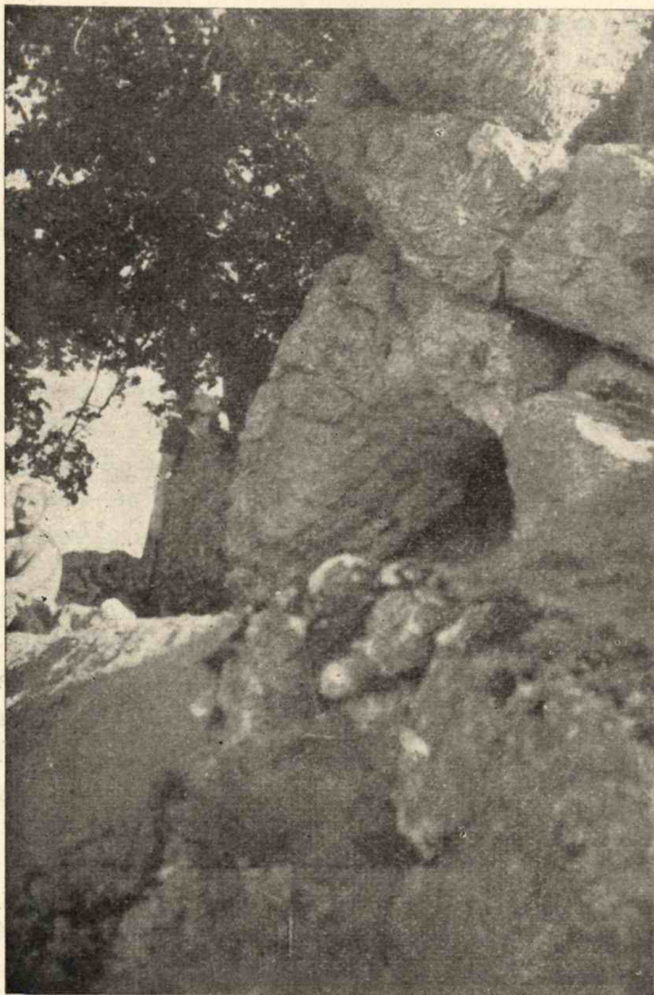
A Benárd-barlang bejárata.

végén, balra lépcsős járat vezet emeletes tornáczra, ahol jobbra és balra egy-egy folyósó látható. A baloldali folyósókhoz nehéz hozzáférni, de a bedobott kő azt bizonyítja, hogy meredeken lejtő, kanyargós járata van, amely visszavezet a barlang főfolyósójához. A jobboldali folyósóban három méternyire lehet előrehaladni, ahol azután összeszűkül. Ugyanitt vízszivárgás észlelhető. A barlang egyébként víznyelő típusú, melynek erózió bázisa valószínűleg a Tapolcai barlang tava, vagy pedig a Balaton szintje lehet. Egyes helyeken a lámpa fényében