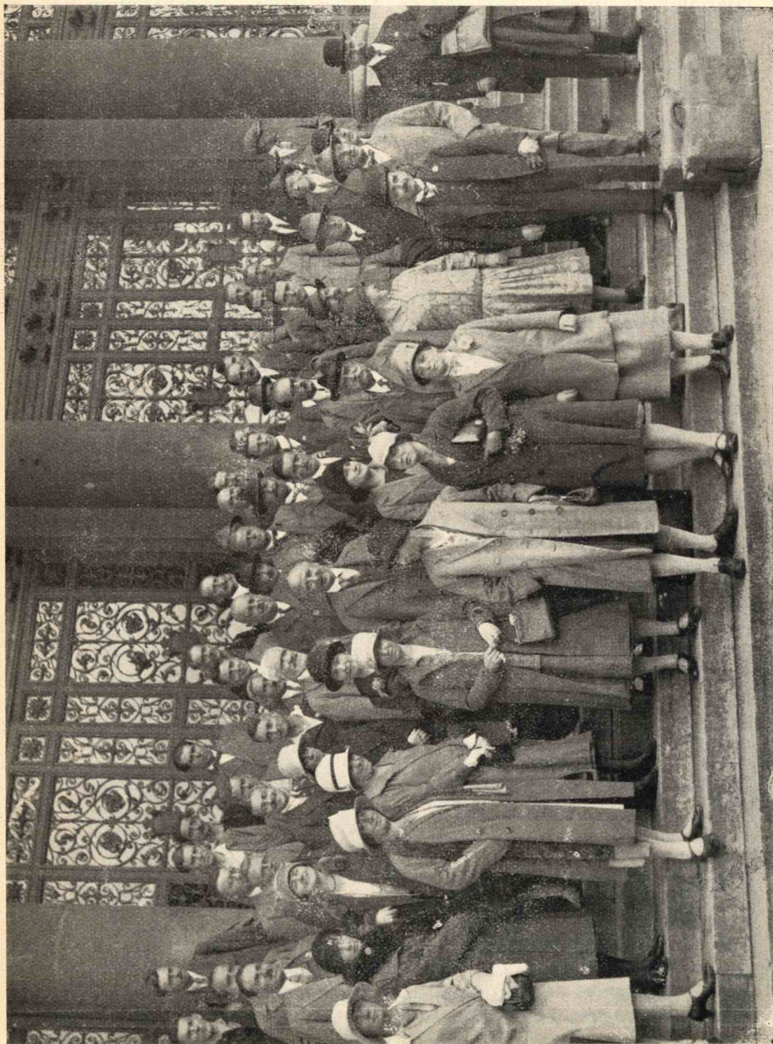
A német és osztrák barlangkutatók megérkezése a Keleti pályaudvaron.