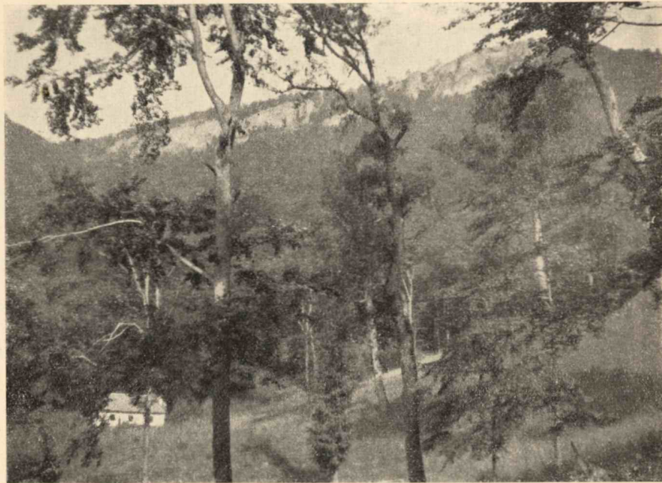
1. kép. A Peskő tájképe; alul a ház, mögötte az őserdő, fent a sziklavonulat, amelyben a barlang van.

A Hideg-völgy alsó kiszélesedett szakaszát elhagyva, a völgy összeszűkül s ebben az alakban mindvégig számos kanyarulatban, fiatal erdővel benőtt bércek között haladunk célunk felé. A táj képe minden egyes kanyarulatnál változik, minden lépésnél új, eddig rejtett szépségek tárulnak szemeink elé. A bércees táj háttérében látjuk a karsztos hegység meredek lejtőjét a peskői és tarkói sziklavonulattal. A esobogó Peskő-patak hol jobb, hol baloldalt útunkon hűségesen kísér. Útközben vékonylábú özikékkal találkoztunk, amint ugrálva felnéznek a kék ég végtelenségébe, ha azután észrevettek bennünket, mozdulatlanul felénk néztek s a hegyoldal bokrai között eltűntek.