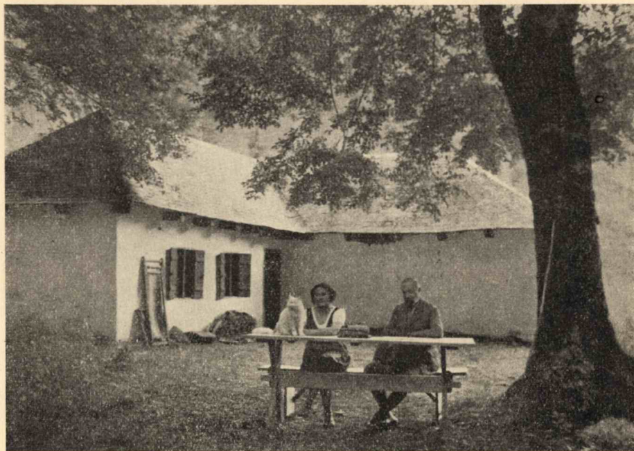
2. kép. A Peskő ház előtt. Előtérben a nagy gyertyánfa az asztallal. Fényk. Hajdu I. 1934.

A megejtett szemle után munkásaink azonnal munkához láttak: kitárták az ablakokat, rögtönzött seprűkkel kitakarították a szobákat, felfrisítették a szalmazsákokat; az egyik munkás kapát fogott és a felburjánzott dudvától megtisztította a ház elejét, a két másik munkás pedig eltakarította a ház körül összegyűlt szemetet. Még csak az egyik asztalt és padot kellett régi helyére, a gyertyánfa alá helyezni, hogy Peskőházán a teljes rend és lakhatóság helyreálljon.