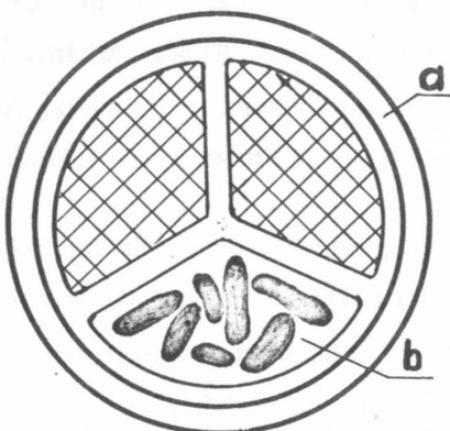
a kernmantelkonstrukció a, köpeny b, többszörös mag

E célokra csak azok a kötelek felelnek meg, amelyek perlonból vagy más műanyagokból készültek, mégpedig speciális eljárással. A legnagyobb biztonságot az ún. Kernmantel-konstrúciójú műanyagkötelek nyújtják. Felépítésüket az ábra mutatja.