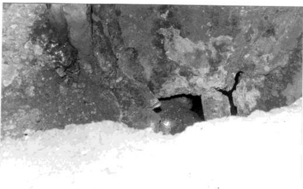
A TATÁR-ÁRKI-BARLANG ÚJ, BONTOTT BEJÁRATA