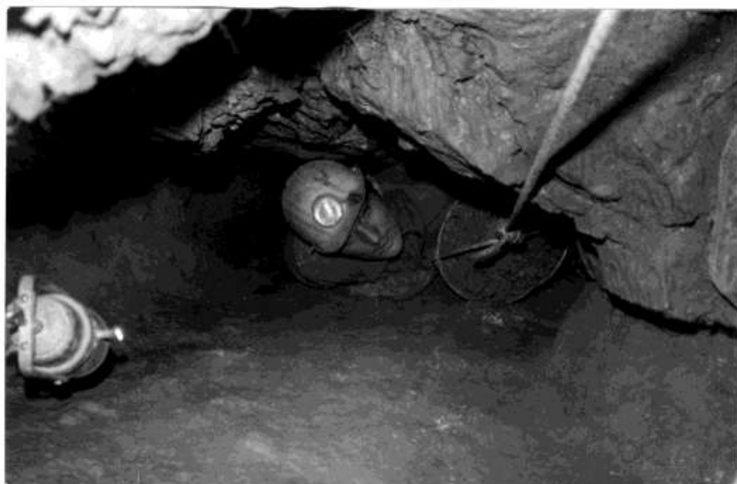
BONTÁSI MUNKÁLATOK A DENEVÉR BARLANGBAN