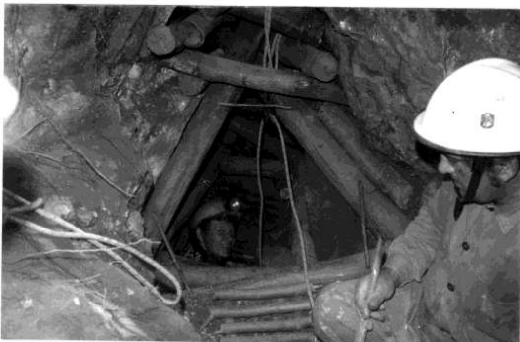
HOLLÓSTETŐI DENEVÉR 3G. BEJÁRATA