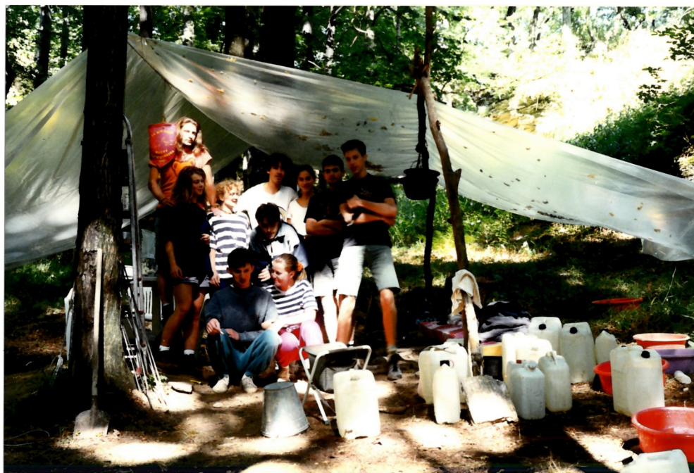
Tábori csoportkép a konyhasátor előtt