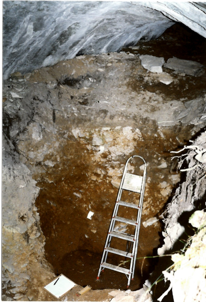
A Pongor-lyuk ásatási profilja 1995-ben