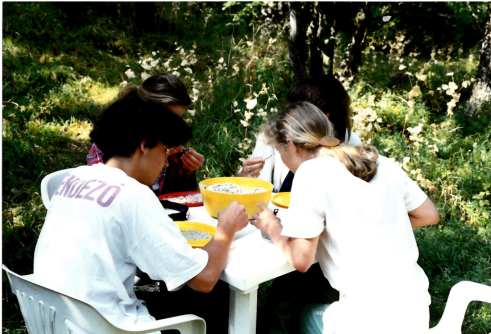
Iszapolt anyag válogatása a táborban