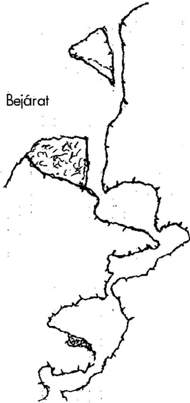
POMÁZI KÉTLYUKÚ-BARLANG vázlatos hosszmetset