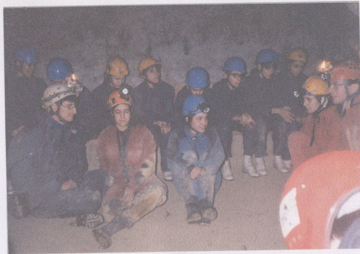
Pihenő a Mátyás-hegyi-barlangban.