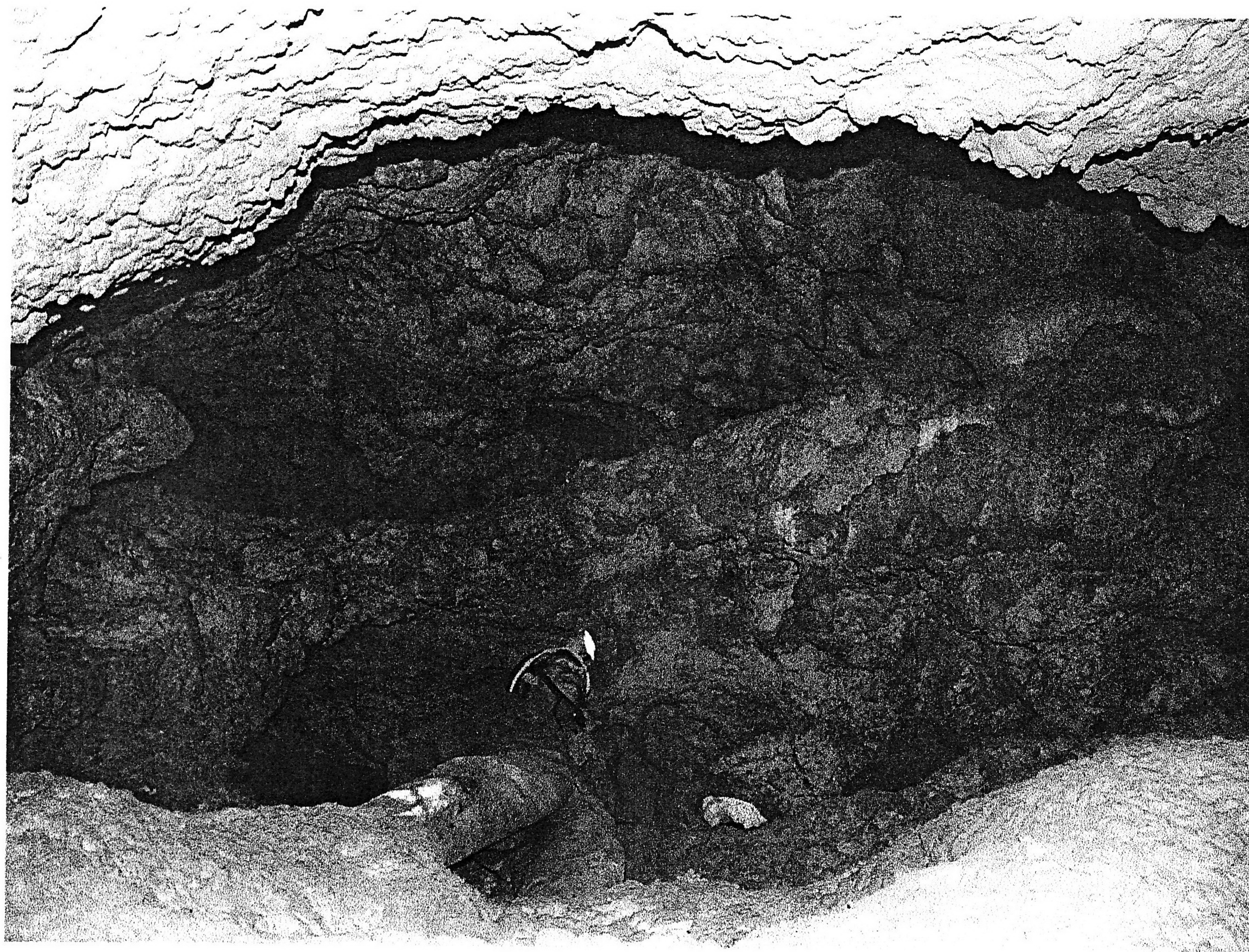
Szentgáli Kő-lik 2002.