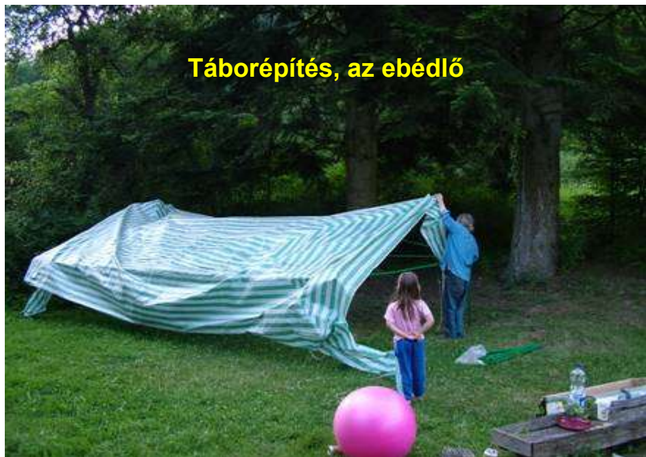
Táborépítés, az ebédlő