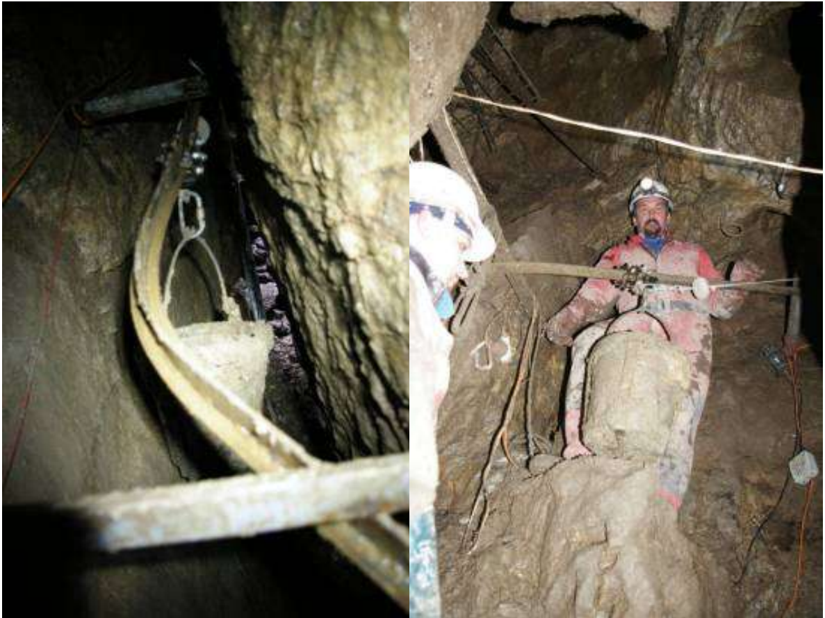
A visszaköltözés után