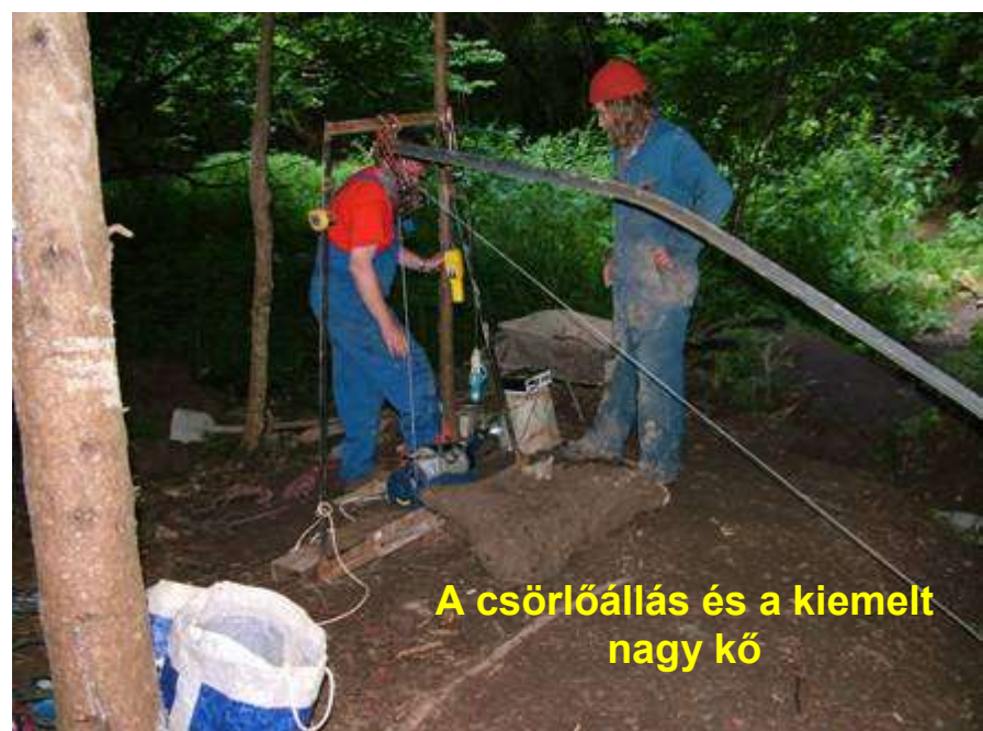
A csörlőállás és a kiemelt nagy kő