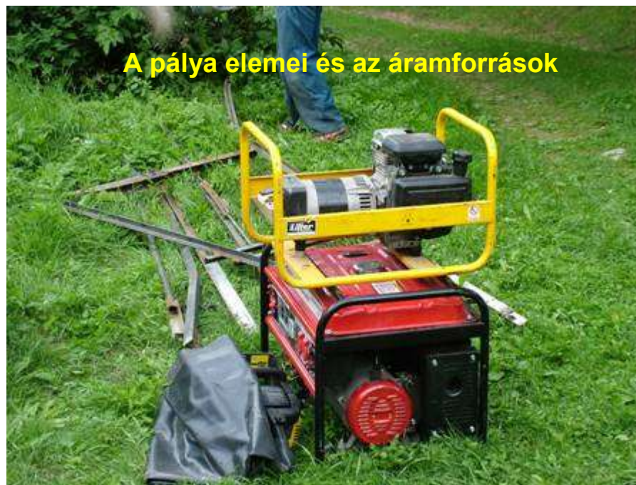
A pálya elemei és az áramforrások