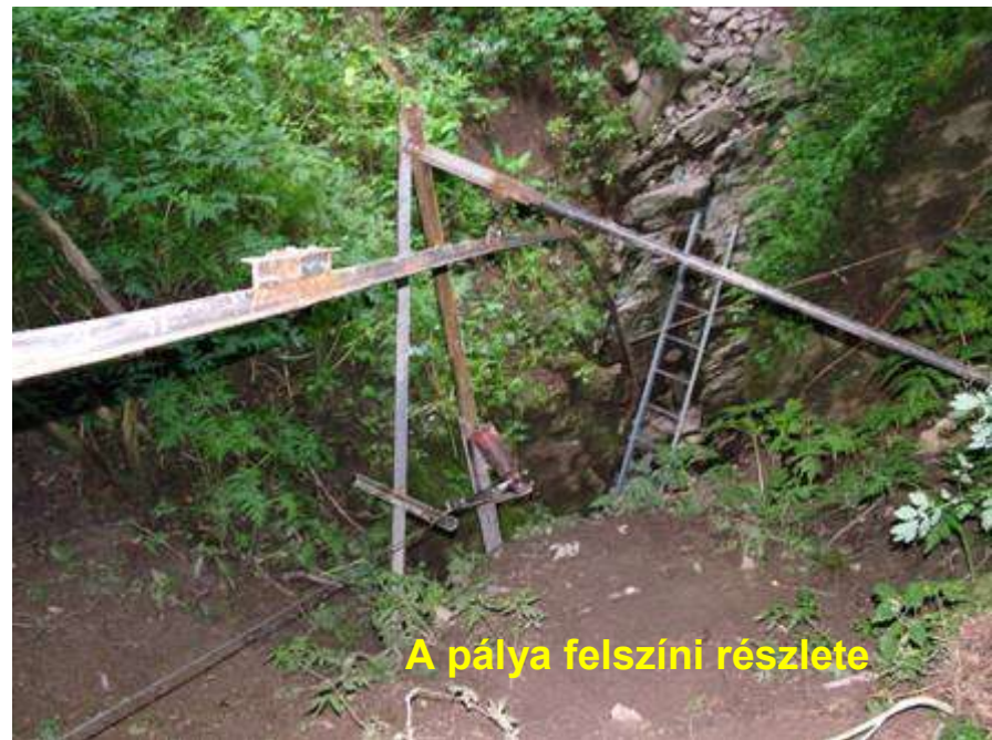
A pálya felszíni részlete