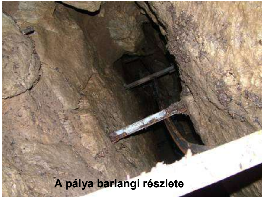
A pálya barlangi részlete