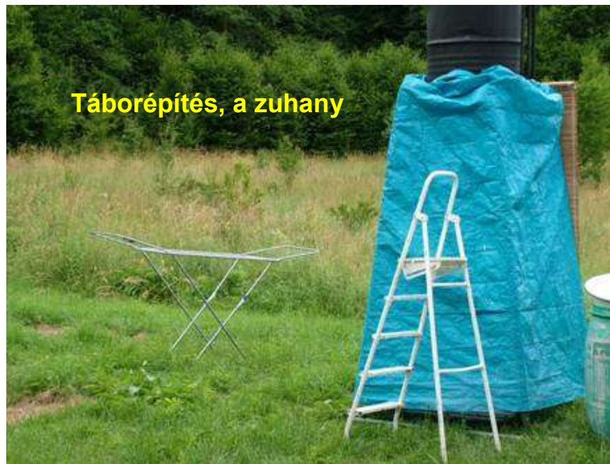
Táborépítés, a zuhany