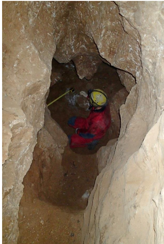
3-5. kép A Rozmaring-barlang végpontja 2016. december 10-én