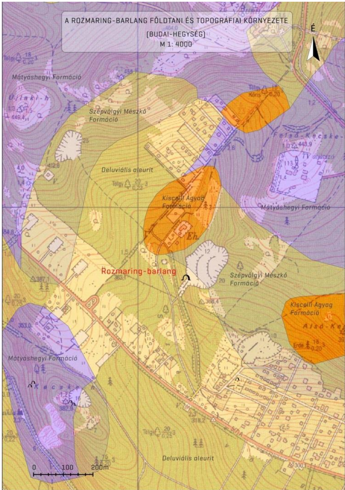
2. térkép A Rozmaring-barlang földtani környezete