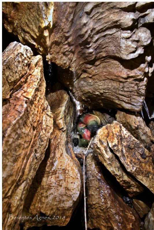
3. A Záporos fölülről ..... és alulról nézve