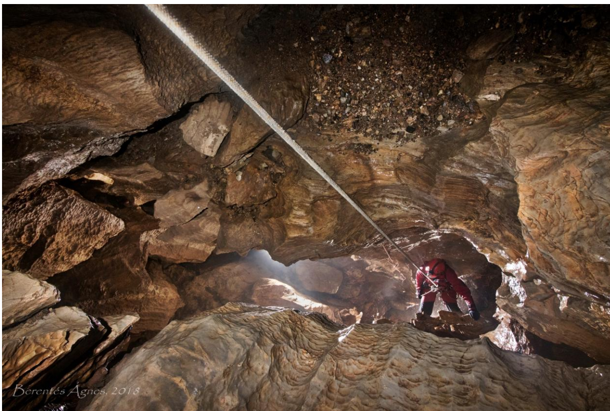
4. Ereszkedés a Jutka-kürtőben