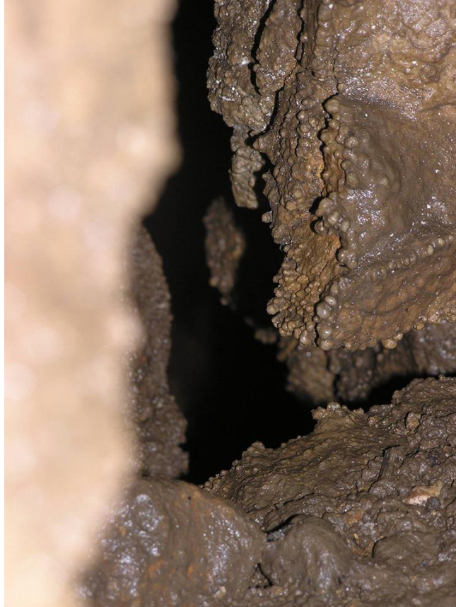
A huzatóló szűk hasadék borsókövei