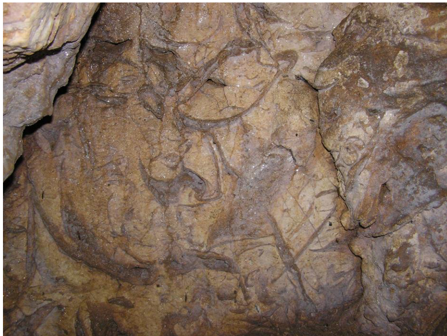
Dachsteini-mészkő, Megalodus fossziliákkal