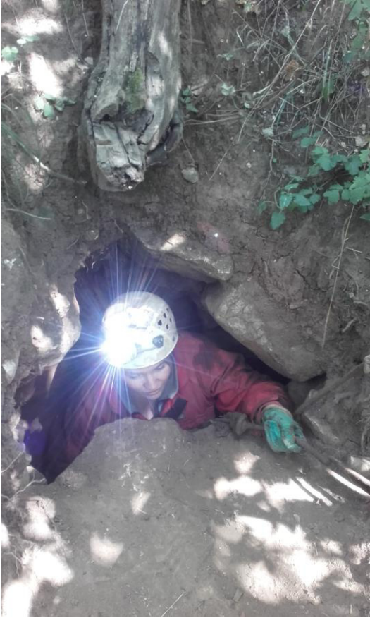
A barlang bejárata