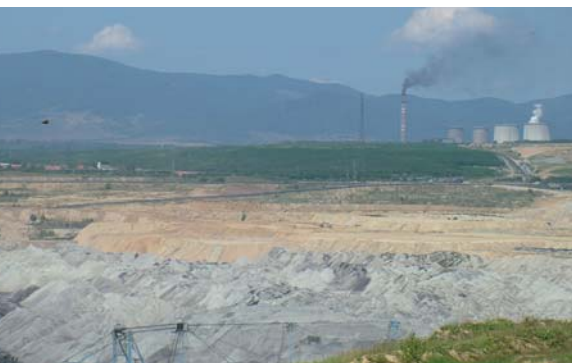
Mátraaljai tájat teljesen megváltoztatta a bányászat és a hőerőmű