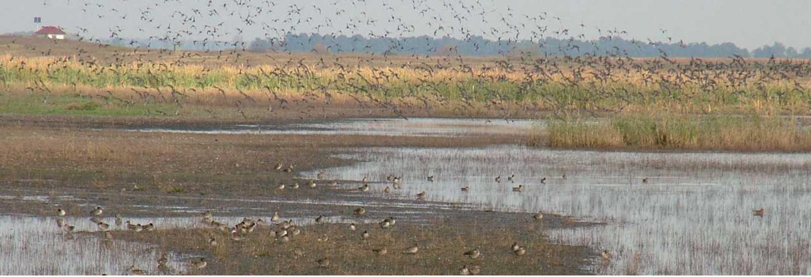
A Hortobágy vizes laposai gazdag madárvilágnak adnak otthont