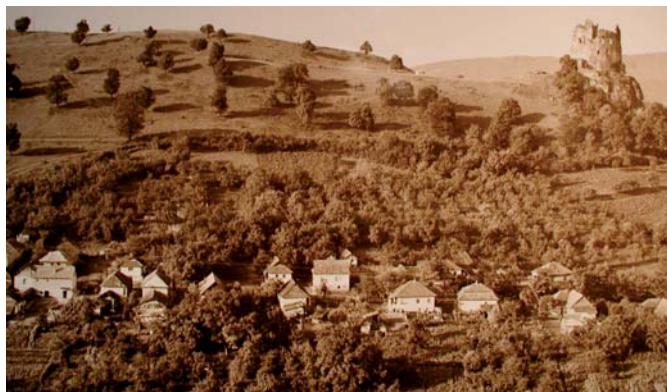
A hollókői hagyásfás legelő egykor és ma

A táj jellegzetes képének, egyedi értékeinek, a tájhasználat lehetőségének oltalma, a már említett és számos további tájleptékű gond megoldása a tájvédelem feladata, a tennivalók elvégzése pedig hazánkban a természetvédelem intézményrendszeréhez tartozik. Ehhez