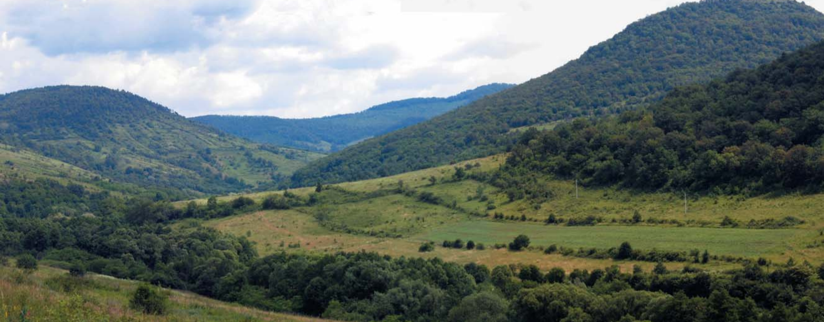
A zempléni Nagy-Egres völgyben még felismerhető a hazánkban egyedülálló kárpáti tájszerkezet

Az emberi létesítmények tájba illesztése különösen nagy jelentőségű az üdülőtérületeken, így a Balaton környékén, ahol az erőteljes turisztikai-rekreációs hasznosítás veszélyezteti a hagyományos tájkarakter és tájkép fennmaradását. A táj jellegének védelme szempontjából fontos Balaton-törvény egyik kiemelt célja, hogy megakadályozza a „széttelepülést”. Elejét vegye annak, hogy az új, jellegtelenszerű épületek megbontsák a kisparcellás szőlőkkel, présházakkal tarkított Balaton-felvidéki táj egységét. Ugyanilyen fontos a tájkarakter- és tájképvédelem az olyan nagy, nyílt, és így a beépítés vagy a hagyományostól eltérő tájhasználat által különösen veszélyeztetett területekben, mint például a már korábban említett Hortobágy és a Kiskunság . A jellegzetes magyar pusztai táj védelmét a Kiskunsági és a Hortobágyi Nemzeti Park Igazgatóság ezirányú tevékenysége biztosítja.