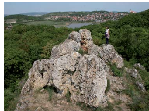
Az Aranyház az egykori utóvulkáni működés emlékét őrzi a Tihanyi-félszigeten

Vállalják, hogy a tájat betagolják a regionális és települési tervezés rendszerébe, és minden olyan ágazati koncepcióba, stratégiába és