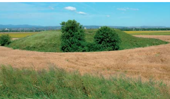
Az ongai Kettős-halom feltehetőleg egyszerre volt kilátópont és temetkezési hely

A tájak védelmét szolgáló másik fontos jogi eszköz a tájvédelmi szakhatósági hatáskörbe tartozó engedélyezési eljárásokról szóló 166/1999. kormányrendelet. Ez a jogszabály mérföldkőnek tekinthető a magyar tájvédelemben, mivel megteremtette a jogi alapot arra, hogy a tájromboló beruházások ellen a védett természeti területeken kívül is felléphessenek az érintett hatóságok.