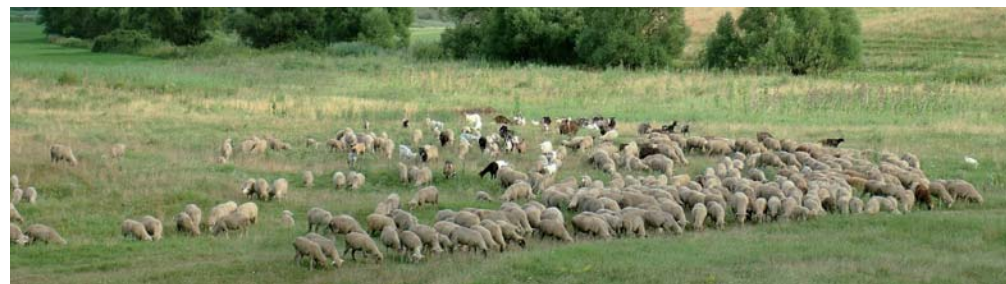
A hagyományos tájjelleg fenntartásához a legeltető állattartás is hozzájárul

Ennek köszönhető, hogy már nem csak a nemzeti parkokban, a tájvédelmi körzetekben és a természetvédelmi területeken, valamint a nemzetközi védelem alatt álló Natura 2000-területeken érvényesíthetők a tájvédelmi szempontok. Ezért vonják be, például az építési hatósági engedélyezési eljárásokba tájvédelmi szakhatósággént a területileg ille-