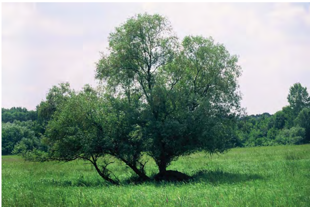
Deme Tamás – Jellegetes baranyai táj