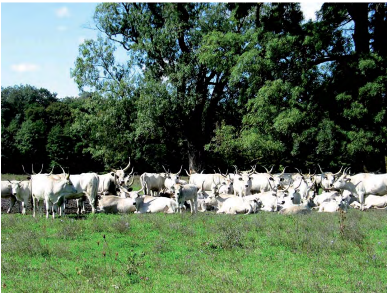
L'Auné Ágnes – Delelő szürkemarkahák

A legelők kedvező életteret biztosítanak a rágcsálóknak, úgymint az erdei pocoknak, mezei cikánynak, törpe egérnek. Az itt élő emlősök közül a nyuszt, a nyest, a mogyorós pele és a vadmacska érdemel említést. Jelentős az ártéri ligeterdők nagyvad (őz, szarvas, vaddisznó) állománya is.