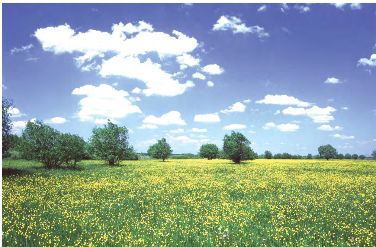
Bodnár Mihály – Virágzó réti boglárka mező

Az Észak-alföldi hordalékkúp síkságon található, népiesen Kishortobágnak nevezett területen helyezkedik el a Borsodi Mezőség MTÉT. Mai formáját a Bükkből érkező patakok és a Tisza alakította ki. A száraz szikes pusztától a magassás mocsár-rétekig terjedő változatos élőhelyeit csak körültekintő gazdálkodással őrizhetjük meg.