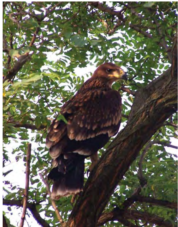
Kleszó András – Fiatal parlagi sas

A terület állatvilága gerinces és gerinctelen fajokban is gazdag. A Bükk erdőségeiben fészkelő ragadozómadarak a hegylábi legelőkön, szántóterületeken találhatnak terített asztalt. Kiemelkedő fontosságú a globálisan veszélyeztetett parlagi sas és a többi Európában veszélyeztetett faj, a békászósas, kígyászölyv, kerecsensólyom, valamint a vándorsólyom itt élő állománya. Számos a fenti felsorolásban is szereplő fokozottan védett ragadozómadár fontos tápláléka az utóbbi időben nagyon megritkult ürge, melynek utolsó, még megmaradt bükkaljai kolóniái csak az extenzív, legeltetéssel kezelt gyepeken óvhatók meg.