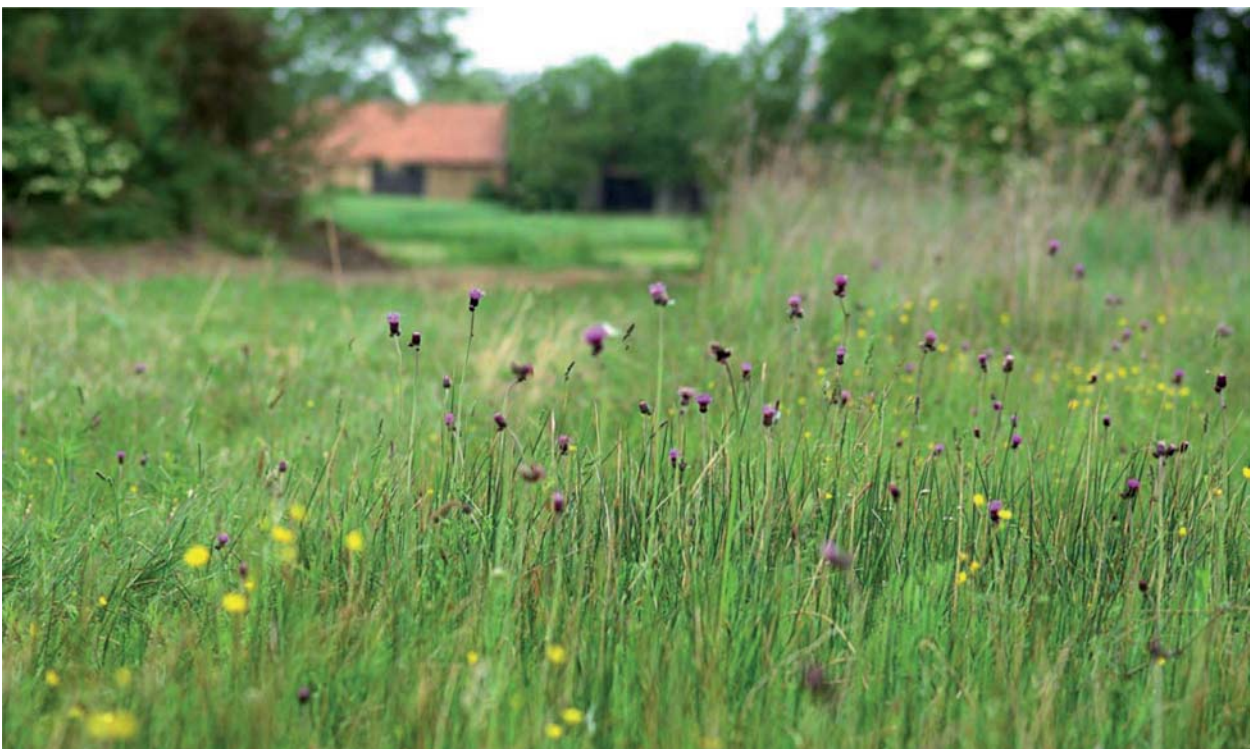
Tóth Szabolcs – Csermelyaszat