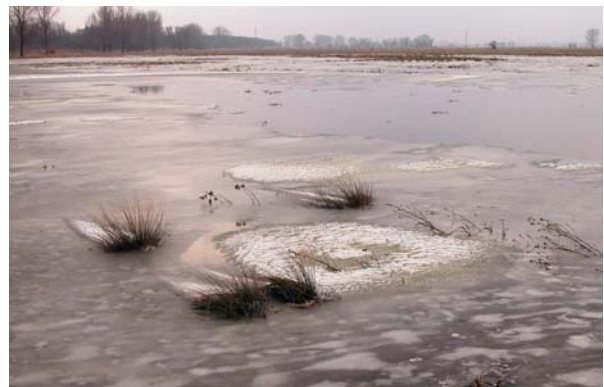
Tóth Szabolcs – Téli táj