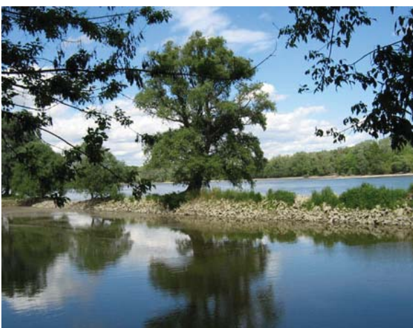
Bezeczky Gergely – Szigetmonostori ártér

A területen 205 madárfaj fordul elő, amelyből 104 rendszeresen költ itt. Az árterek, vizes élőhelyek szórványos, de rendszeres vendége a kiskócsag, gyakori a nagykócsag. A homokos partoldalokban mintegy 100 pár gyurgyalag költ.