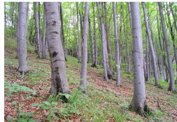
A hóvirág egyik tipikus élőhelye, a bükkös

Mivel a gyűjtők a legfeltűnőbb szálakat szakítják le, csak a silányabbak érlelhetnek magot, így a populáció genetikai állománya lassan, de biztosan megváltozik, például a Budai-hegység hóvirágai a nehezebben megközelíthető lejtőkön élő egyedek feléig sem érnek.