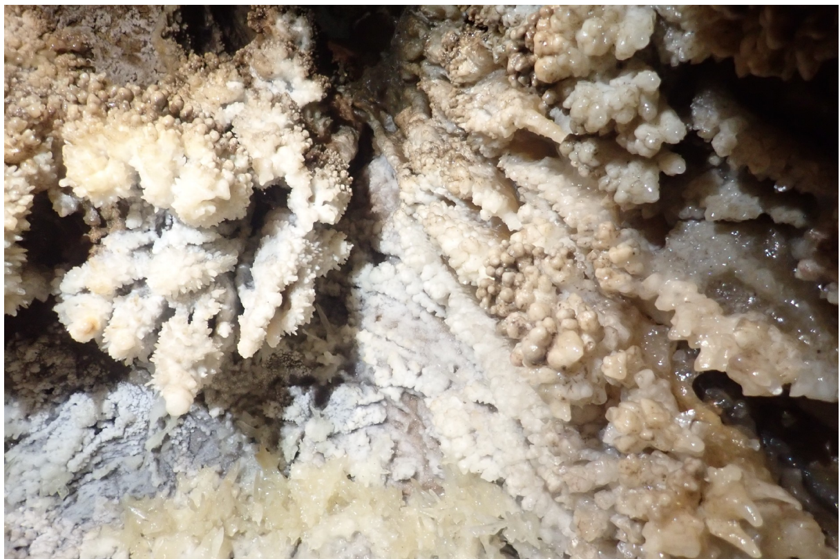
Jellegzetes falfelület a Micsodák-palotájában. (Szabó Z.)