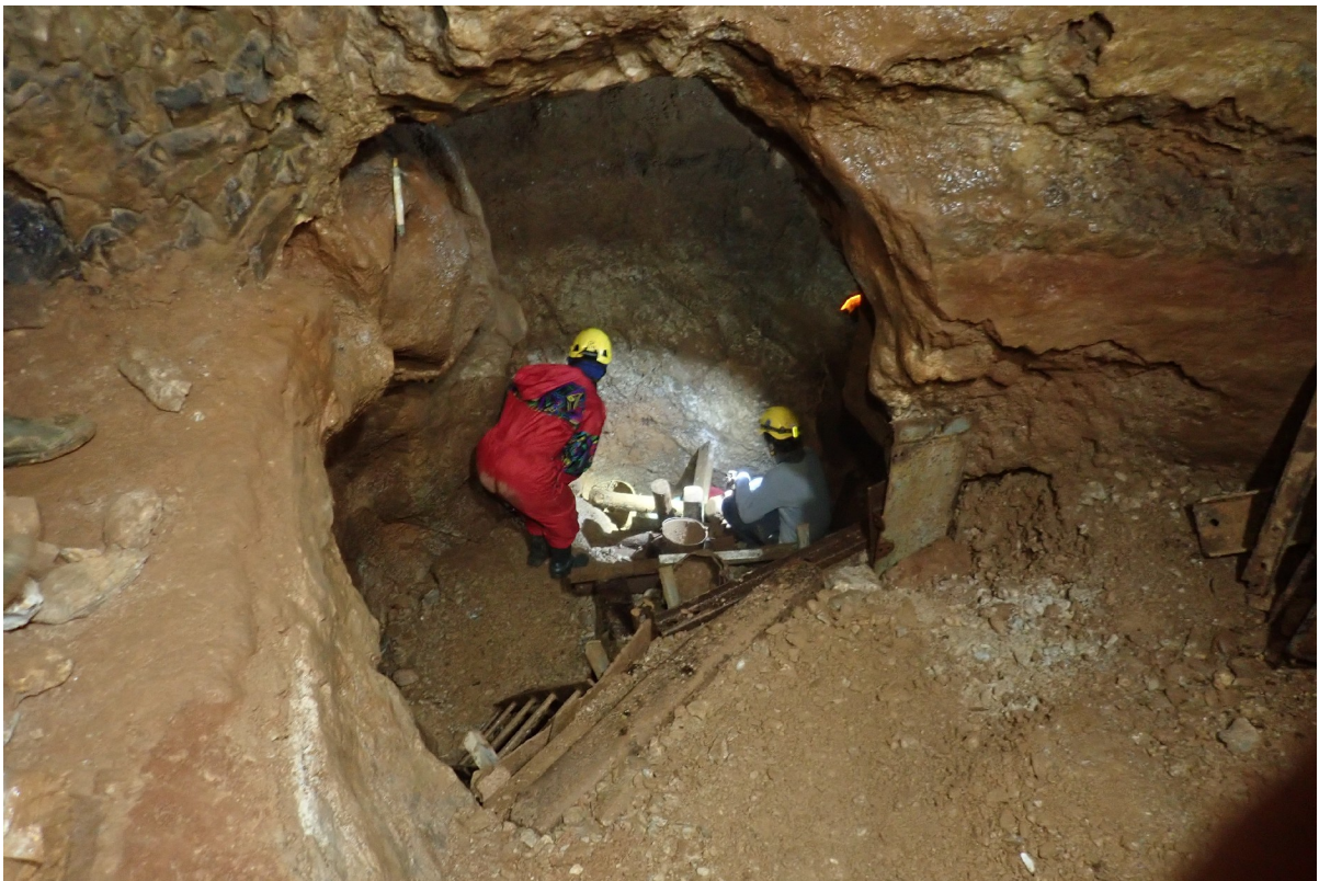
A teremmé szélesedett fülke 2021. januárjában. (Szabó Z.)