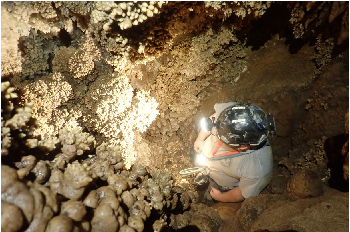
A Micsodák-palotájának alsó szintjén a falakat borsókó, és az előtérben látható „hagymák” borítják. (Szabó Z.)