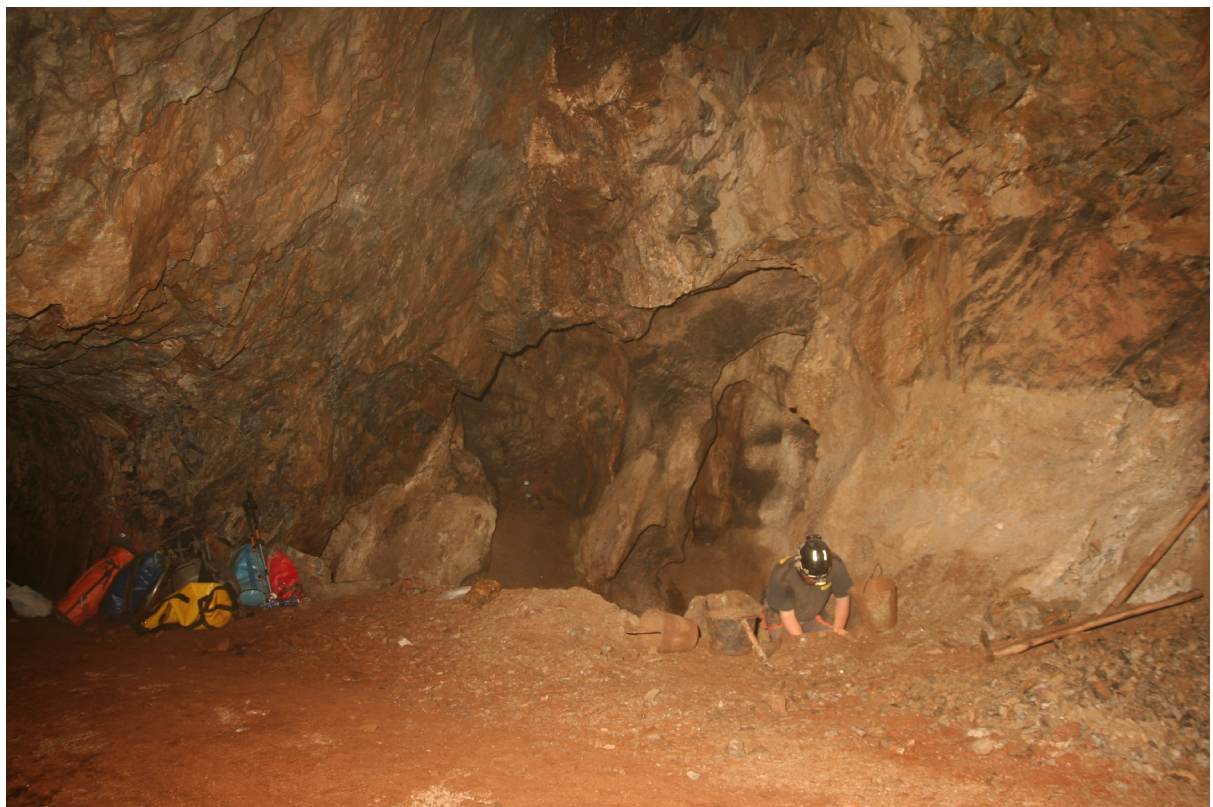
A Gömbüstökös előtt megtisztított térszín, jobb oldalon a bontás folytatása (Szabó Z.)