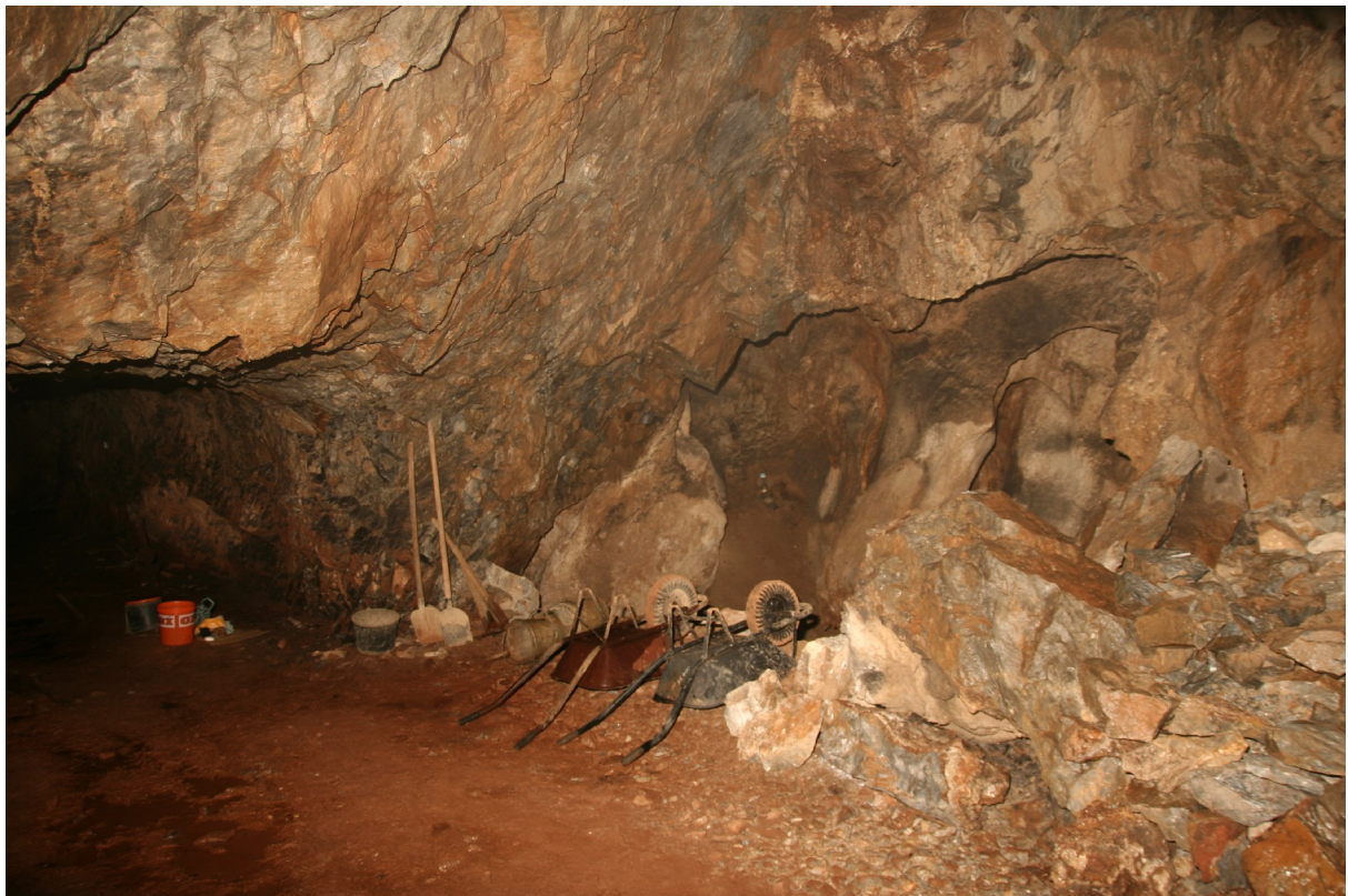
A Gömbüstökös-barlang 2020. februárjában. (Szabó Z.)