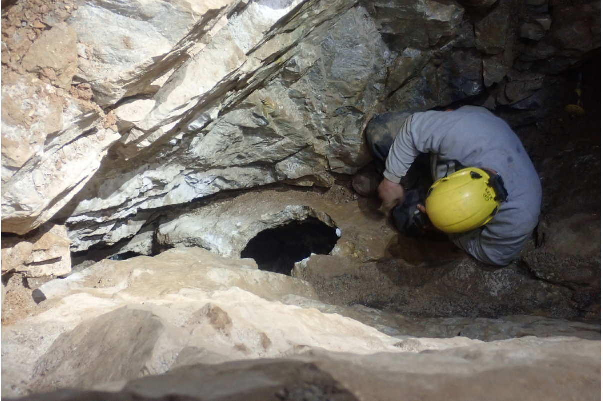
A kibontott hasadék alján felnyitott terem teteje. (Szabó Z.)