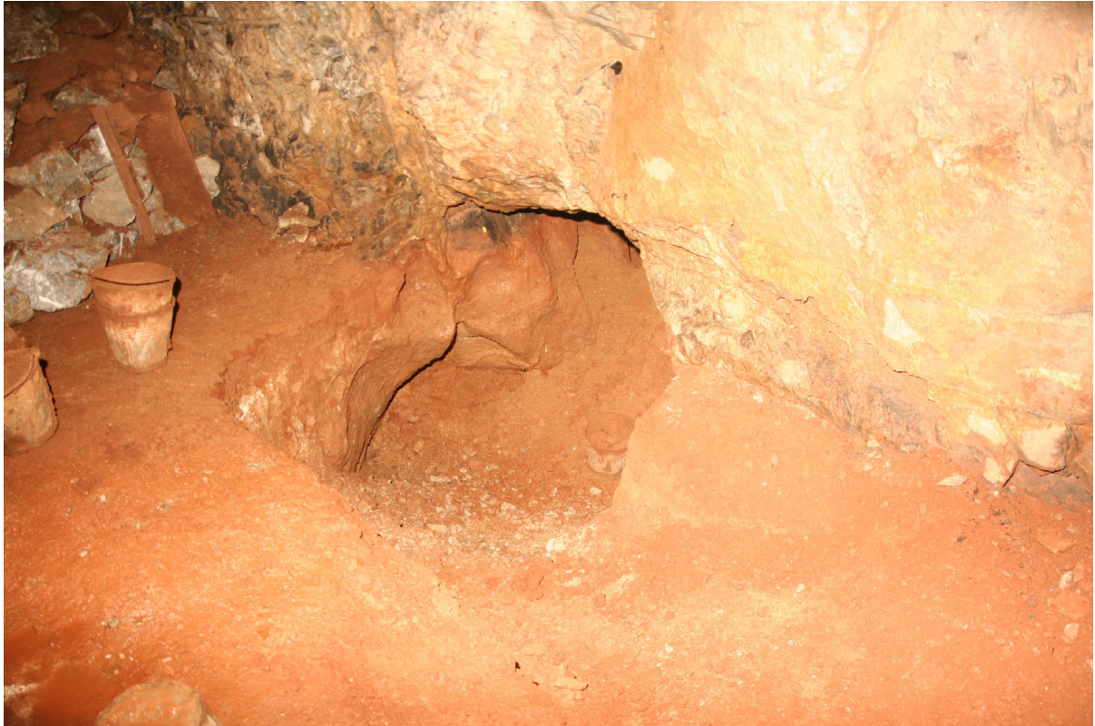
A Covid-fülke 2020. februárjában. (Szabó Z.)