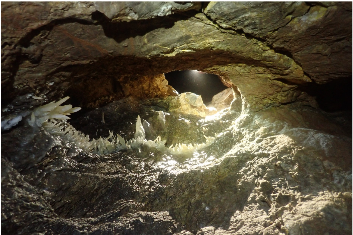
A hasadék alján megnyílt terem ugyanott, bentről kifelé nézve. (Mátó Gergely)