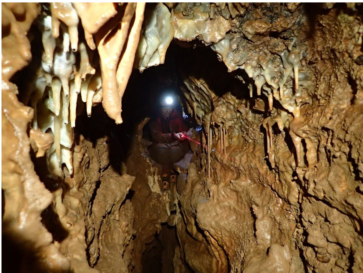
Térképezés a Huncut meanderben.