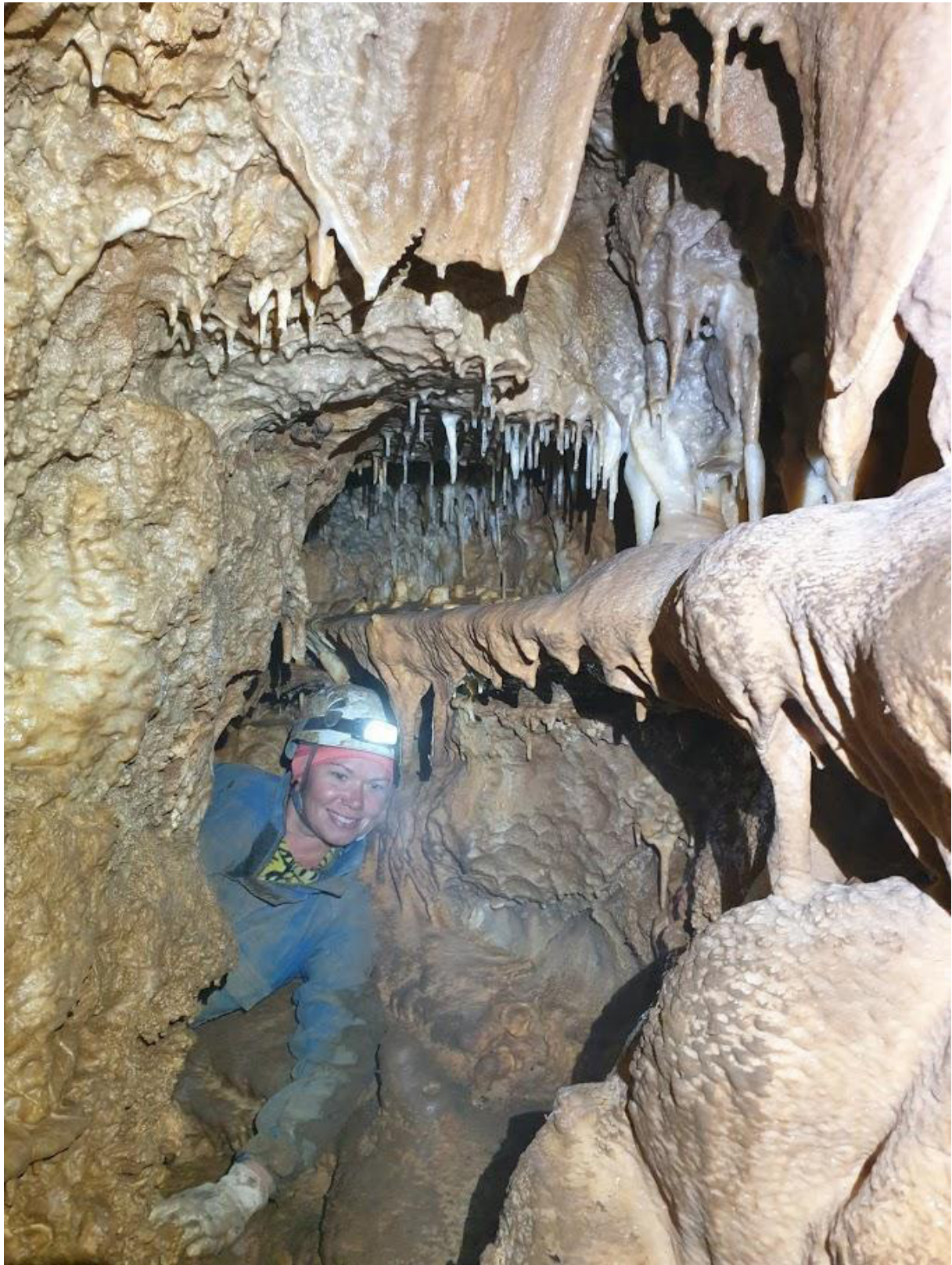
A huncut meander még "tágabb" része.