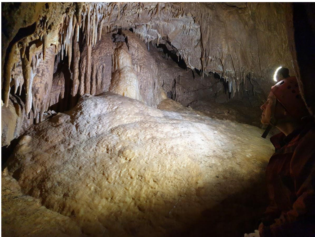
Az első nagyobb cseppköves folyosó eleje.