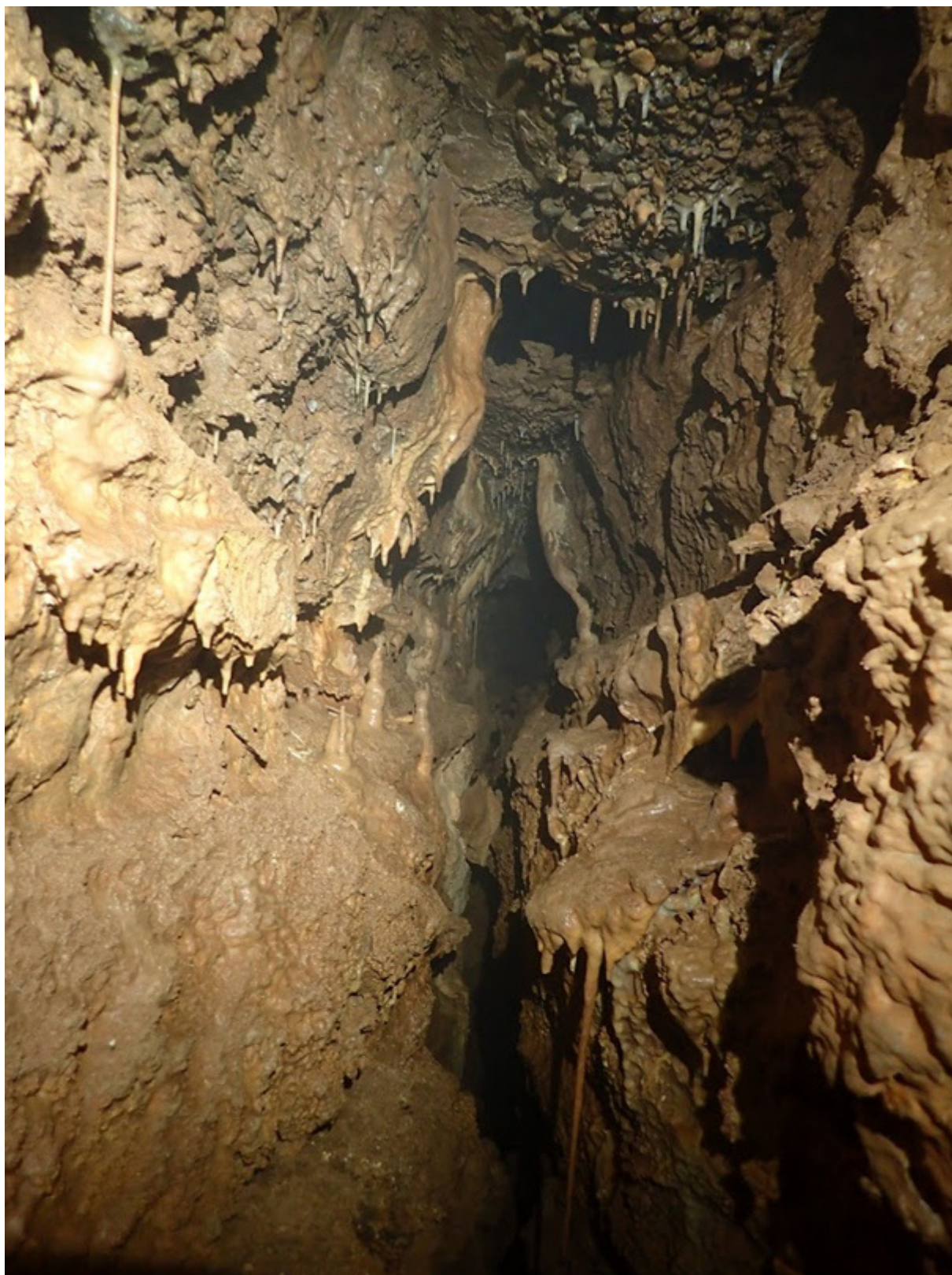
A jelenlegi végpont.