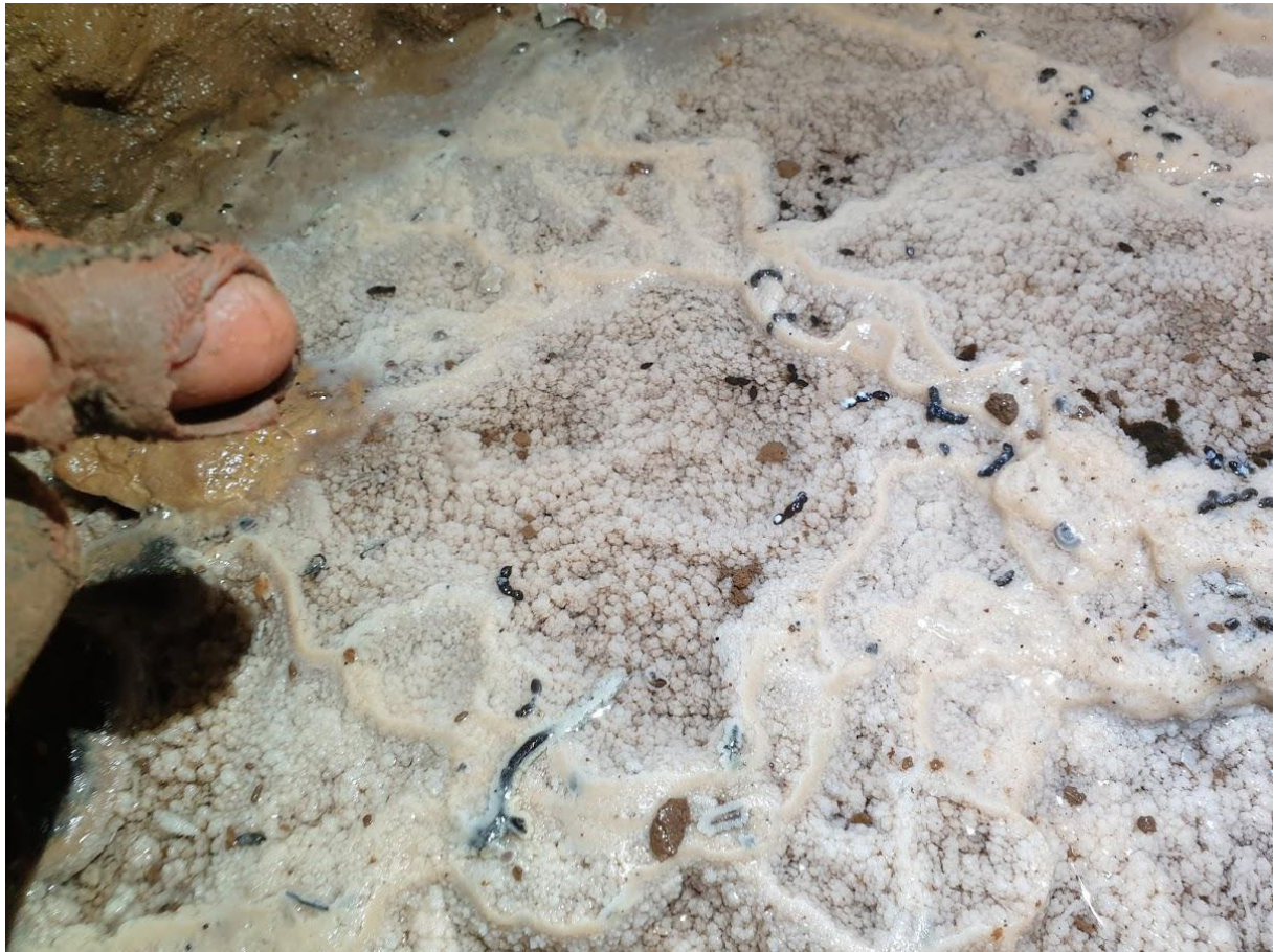
Cseppkőmedence denevér guanóval.