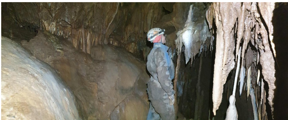
Gyönyörű cseppkövek az új rész állva járható részében.