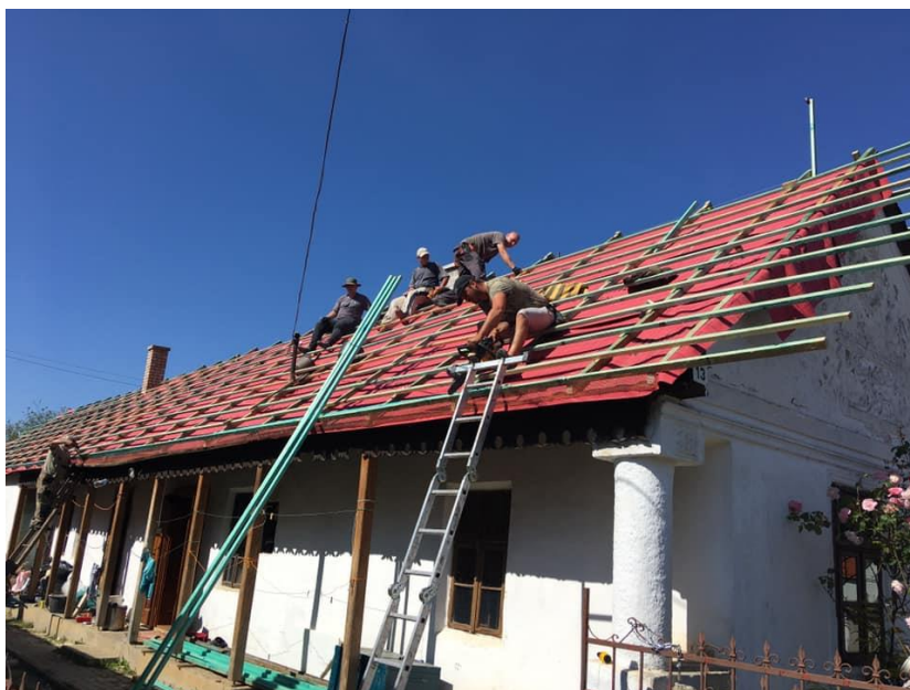
4. sz. fotó. Tetőcsere

2021. szeptember 3-12.: A kutatótáborban a barlangban munkálatot nem folytattunk, megkezdtük az aggteleki hát tetőcseréjét.