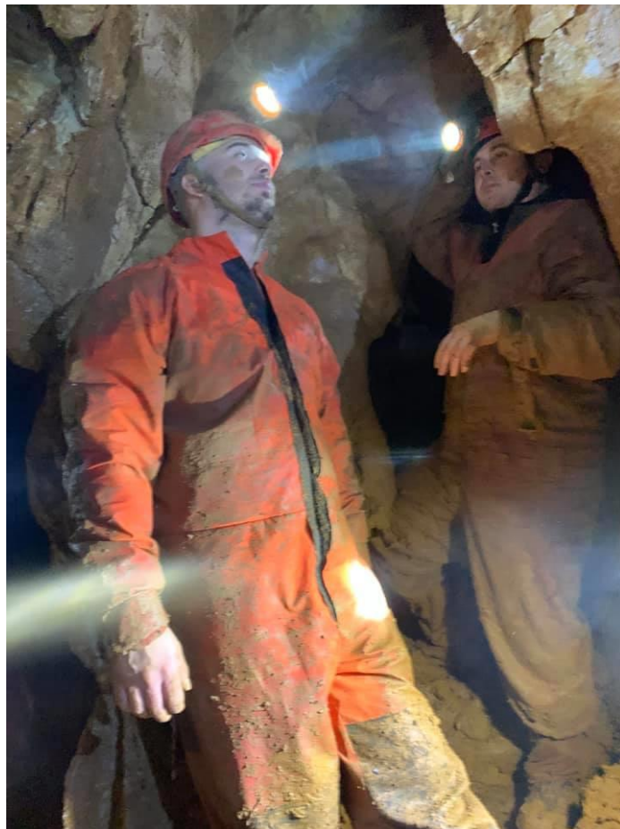
1. sz. fotó. Az alsó tágas járat

2021. január 6-10.: Folytattuk a leszakadt kőzetblokk mögötti akna kitöltésének teljes szelvényű bontását. Az egész hétvégén nagyon erős, szinte esőszerű csepegés jellemezte a barlang alsó részét. A kitöltés agyagos kötőanyagban lévő apró mészkő kőzettörmelék. A rendkívül szűk aknában a bontás meglehetősen körülményesen haladt. A kiásott szakasz hossza: 2,3 m.