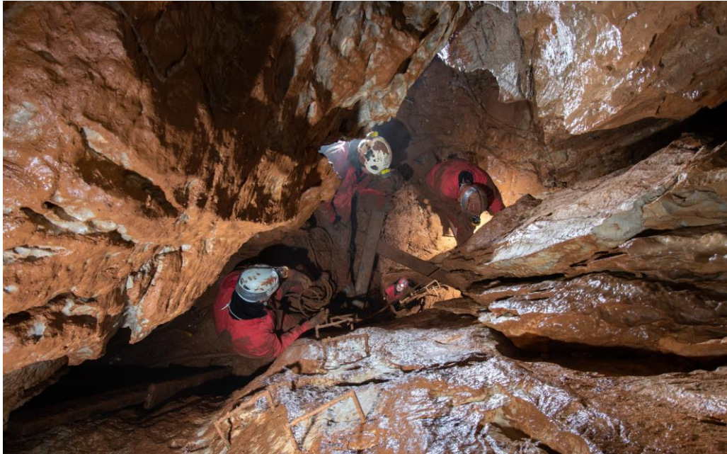
3. sz. fotó. Ideiglenes lépővasak az alsó akna falán

2021. június 03-05.: Folytattuk a szifonkerülő, fosszilis járat kitöltésének bontását. A kitöltés és a főte között egyre nagyobb a légrés, és az ismeretlen barlangjárat irányából folyamatos huzat érezhető. Előrehaladás 1,5 méter.