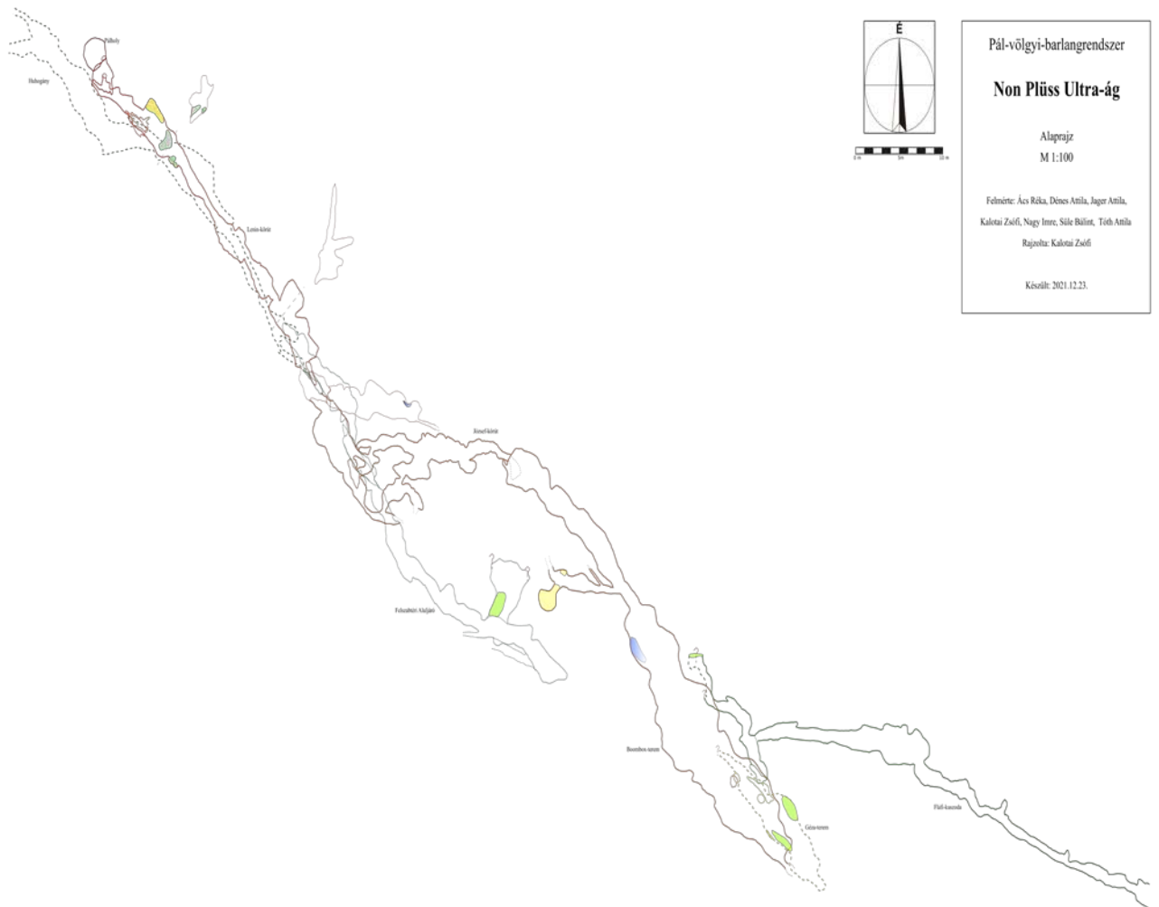
A Non Plüss Ultra ág alaprajzi térképe