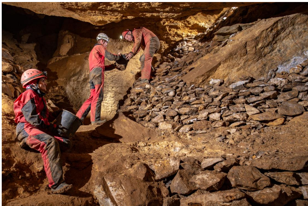
2. fénykép. A Kulcs-termi depó alsó szakasza 2022. február12-én.

2021-ben innen kiindulva, a járat eddigi irányának megfelelően egy 30°-os meredekségű, 3-4 méteres, kifejezetten oldott oldalfalú gömbfülkét találtunk, amelynek a felső fél métere levegős volt, és szép mangános kiválások díszítik (4. fénykép). Sajnos, a