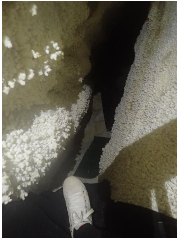
8. Az alján izolierrel védett kutatási végpont Repülőtér mellett.