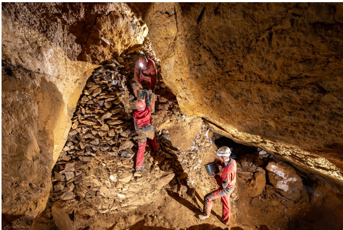
1. fénykép. A Kulcs-termi depó középső szakasza 2022. február12-én.