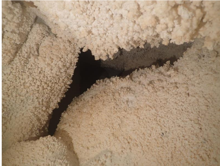
7. fénykép. Gazdag kiválások a Reptér melletti kutatási ponton.

Ezen a környéken (a Repülőtér szintjén) valószínűleg hosszú időn keresztül volt állóvíz, és mindenhol olyan vastagságú kalcit kéreg (szinte mindig hófehér) rakódott le, hogy minden rést, járatot eltömött. Ráadásul általános a kalcit kérgen a gazdag kiválás. Ezen a szinten sehol nem látjuk reálisnak a továbbjutást, egyedül a mostani bontásponttól mintegy 15 méterre vissza nyugatra van egy megnézni való elágazás (zsákutca).