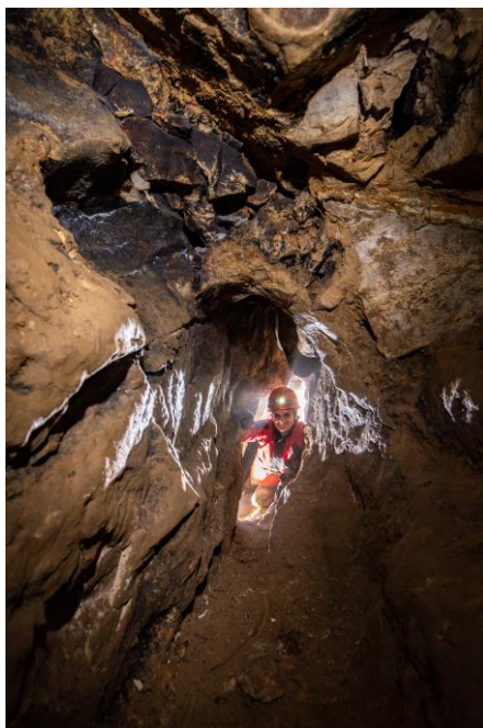
6. fénykép. A jelenlegi végpont előtti szakasz a hasadéokban.