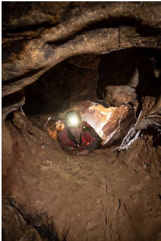
5. fénykép. A 2021-ben kibontott Csempész-alagút.

haladtunk tovább a Csempész-folyosó folytatásában, ahol mangános kiválásokkal, és törmelékekkel találgottunk (1. ábra).