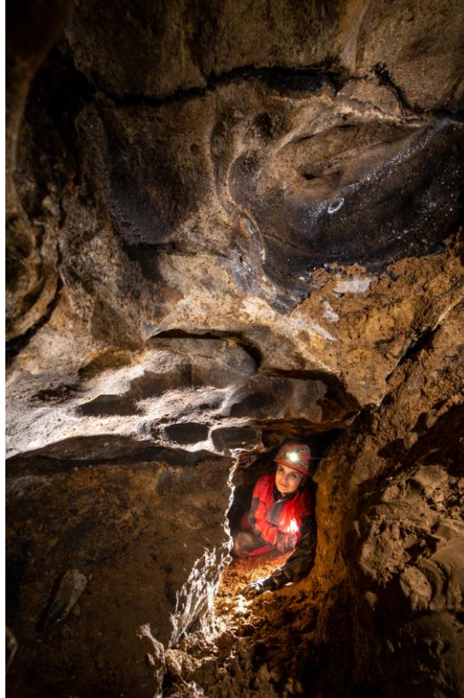
4. fénykép. A 2021-ben talált, részben nyitott gömbfülke.