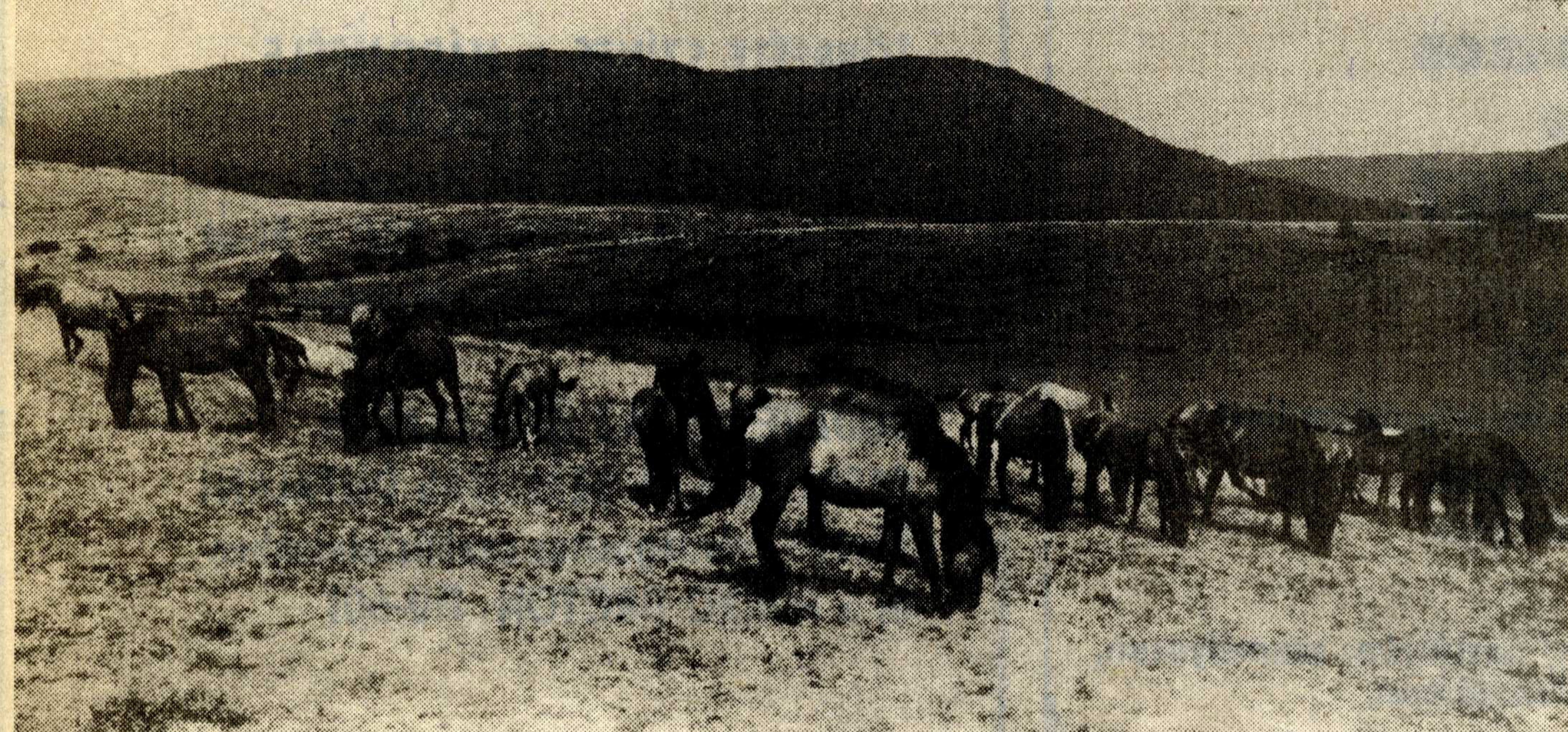
A sokat vitatott huculok.

nak. S mindezt így indokolták; a hivatalos közeg az egy szem jósvalfői erdész volt, aki reggelenként kilgancolt állapotban végigparádézott a faluban, majd ilyen módon megszilárdítva tekintélyét, a kertek alatt hazaosont, leitta magát, és az áldott pihenés állapotába süppedt. Aztán jöttünk mi. Húztunk egy vonalat a térképen, és közöltük, hogy itt most nemzeti park lesz, s ettől kezdve sok minden másként kell hogy legyen, ezt nem szabad, amaz megtilos lesz — és így tovább.