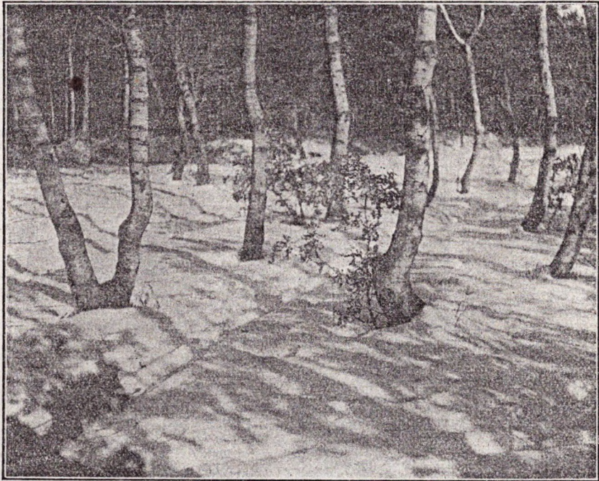
A Bükk téli álmát alussza...

Cserépfalunak Zsérc a szomszédja. A két falu két régi vetélytárs. Amaz ugyanis majdnem egészen kálvinista, Zsérc azonban felemás; a pápisták itt már