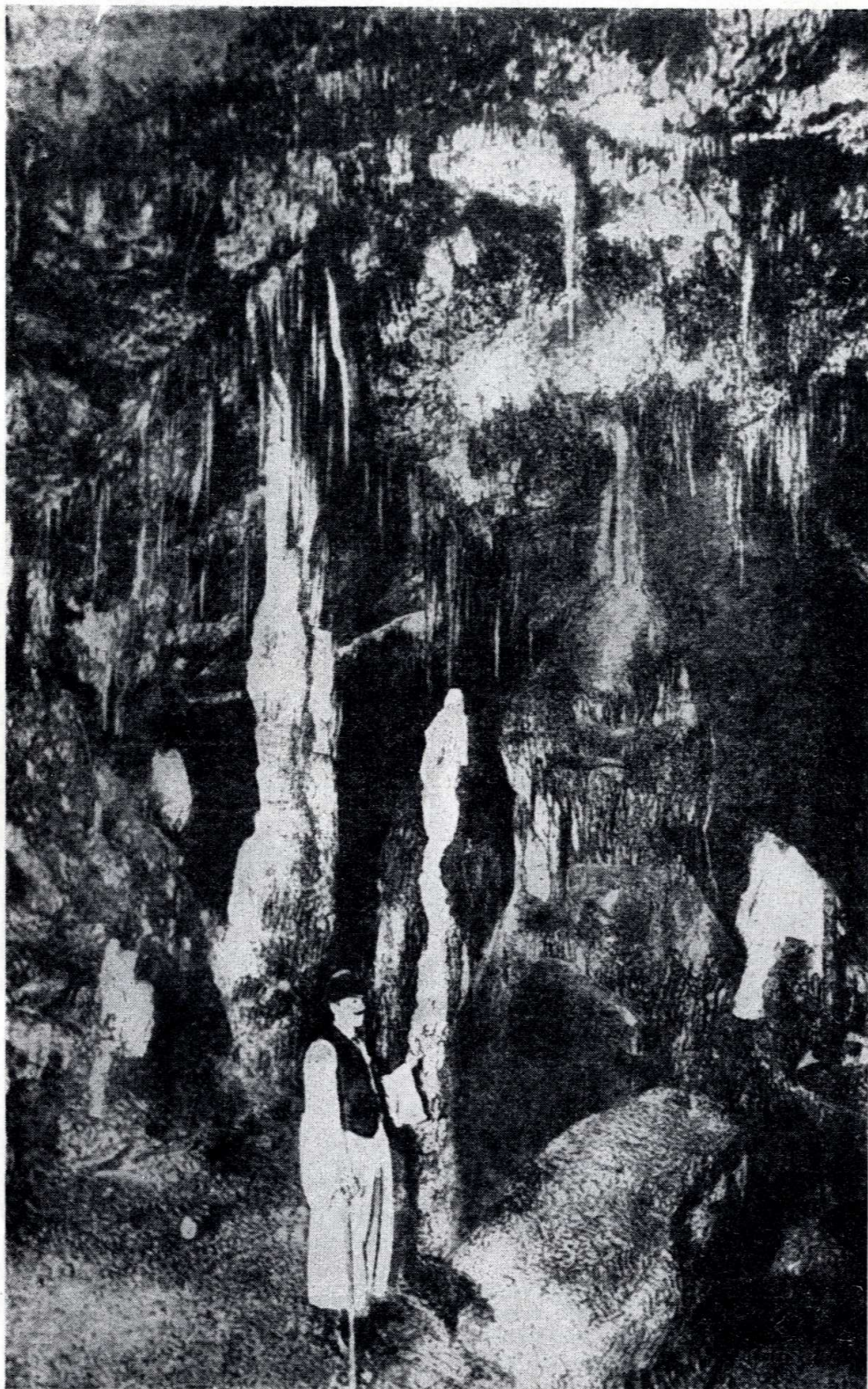
1. ábra. Egykorú fénykép (1892.) az Aggteleki-barlangból: Szent László szobra.