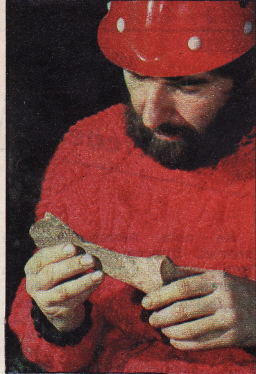
A Baradla-88 nem jött fel üres kézzel: a jégkorszakban élt barlangi medve és ember csontmaradványait szakavatott régészek fogják majd azonosítani

A Baradla-barlang 25 kilométeréből 7 kilométernyi szakasz Domica néven átnyúlik Csehszlovákiába, mint az a térképen is látható