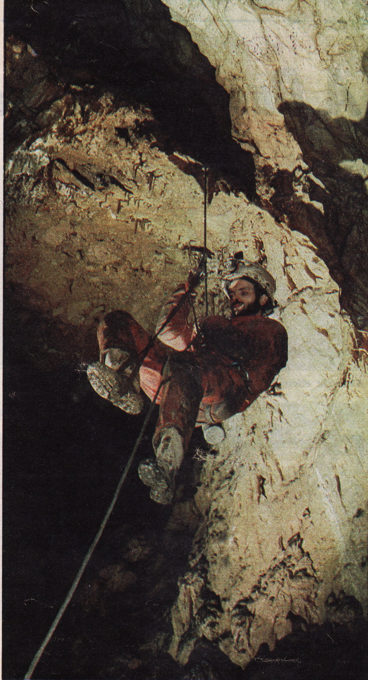
A modern alpinista technika segítségével új kürtöket tártak fel

A Baradla-barlang 25 kilométeréből 7 kilométernyi szakasz Domica néven átnyúlik Csehszlovákiába, mint az a térképen is látható