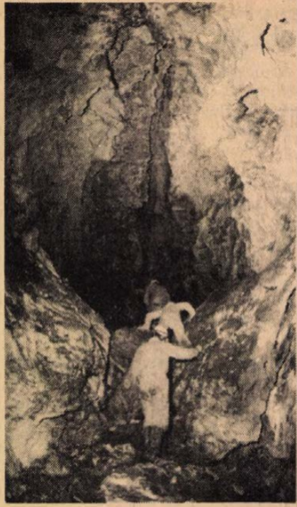
Kutatók a József-hegy mélyén.

És vajon az említett, gyógycélra alkalmas barlang a Szabadság híd lábánál, a Gellért-fürdővel szemben — egykor lakások voltak benne, aztán kápolna, jó ideje befalazták bejáratát — semmire sem alkalmas? Dehogyan, a kívánalom a funkcióval szemben csupán az: ne tegye tönkre. A Fővárosi Idegenfor-