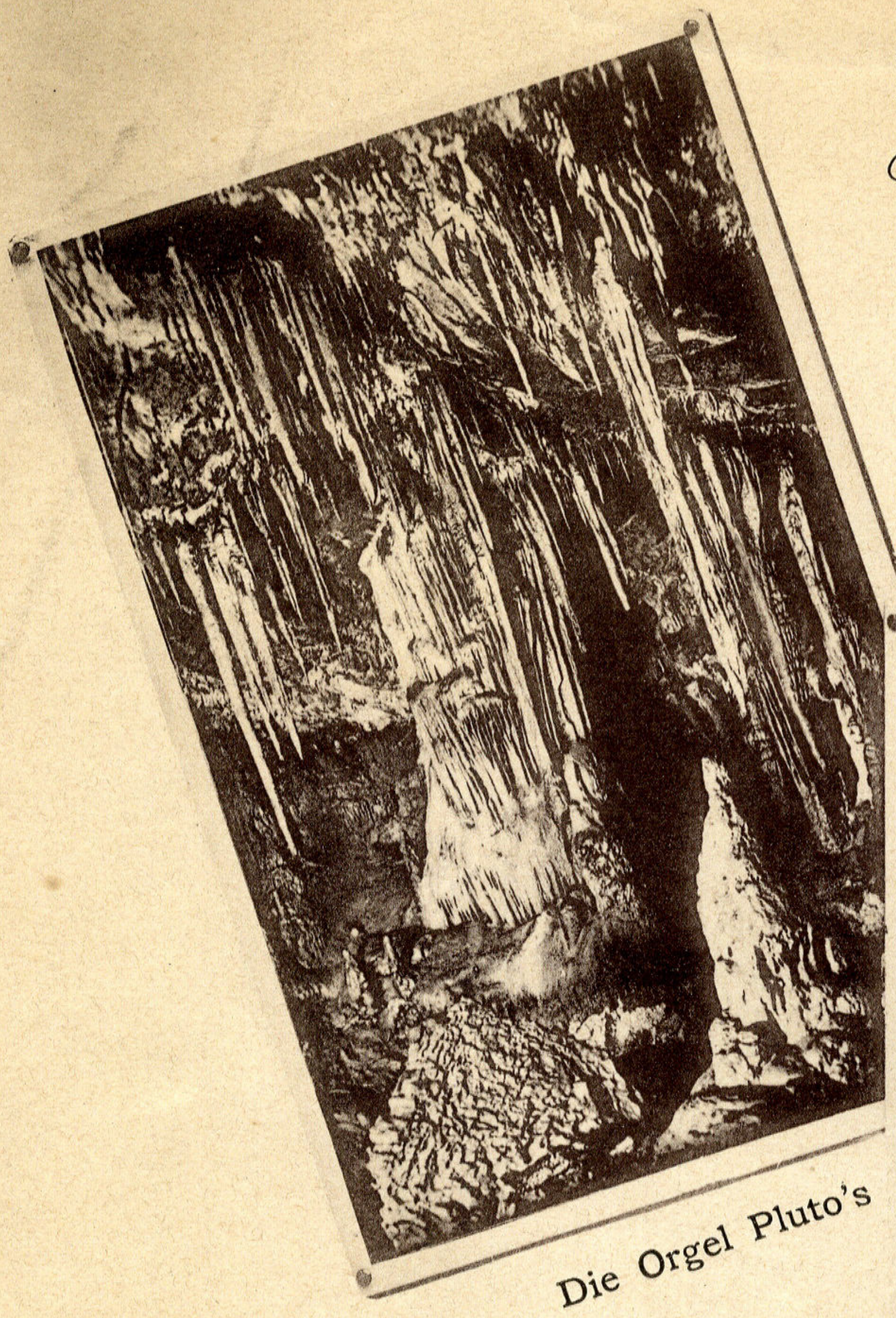
Die Orgel Pluto's